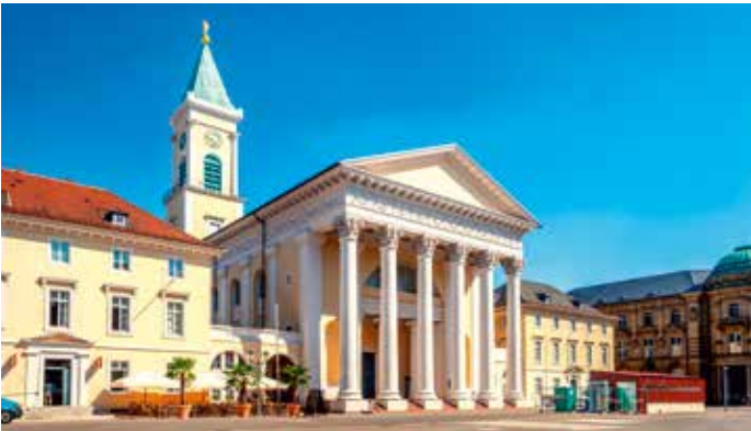
Stadtkirche von Karlsruhe