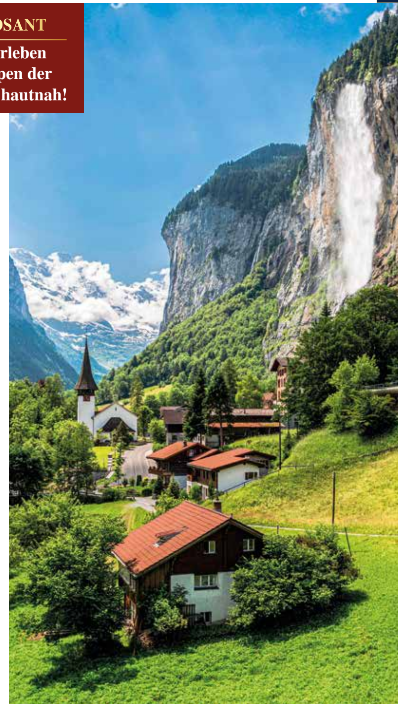
Staubbachfall: höchster frei fallender Wasserfall der Schweiz

Wir erleben die Alpen der Schweiz hautnah!