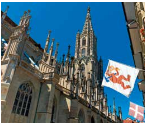
Das beeindruckende Münster in Bern