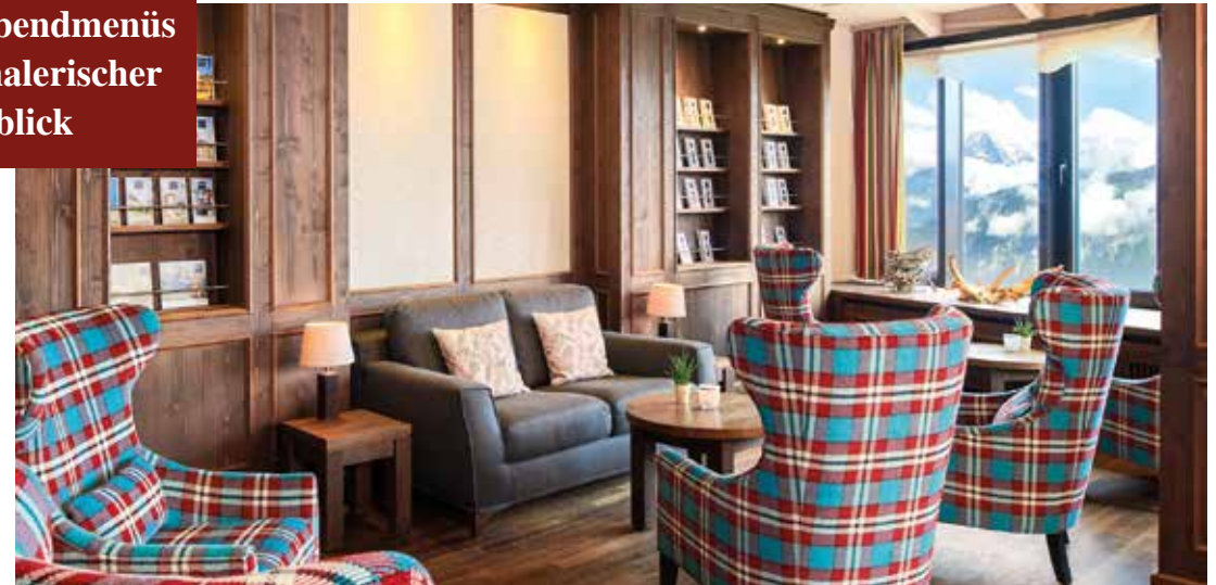
Alpines Wohlbefinden in der Lobby mit Alpenpanorama

Halbpension mit Frühstücksbuffets, 3-Gänge Abendmenüs und ein malerischer Ausblick