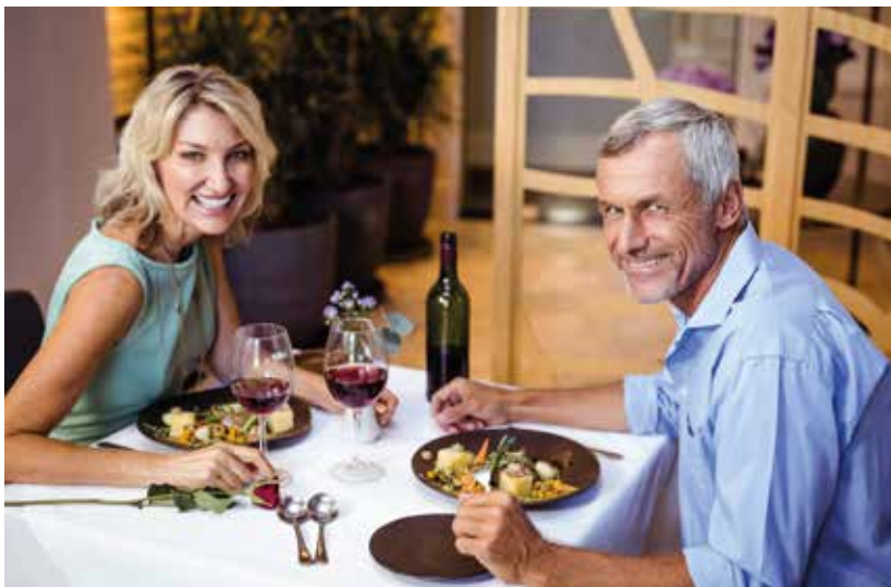
Wir lassen uns nach allen Regeln der Kochkunst verwöhnen