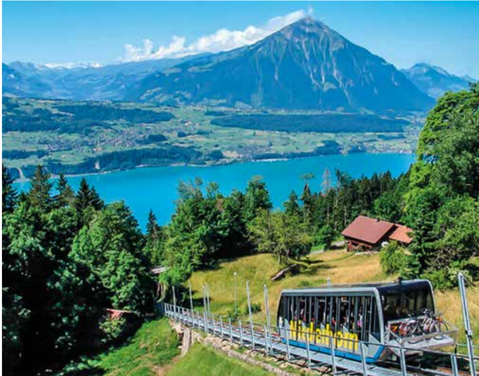
Die Standseilbahn bringt Sie bequem vom Beatenberg zur Beatenbucht