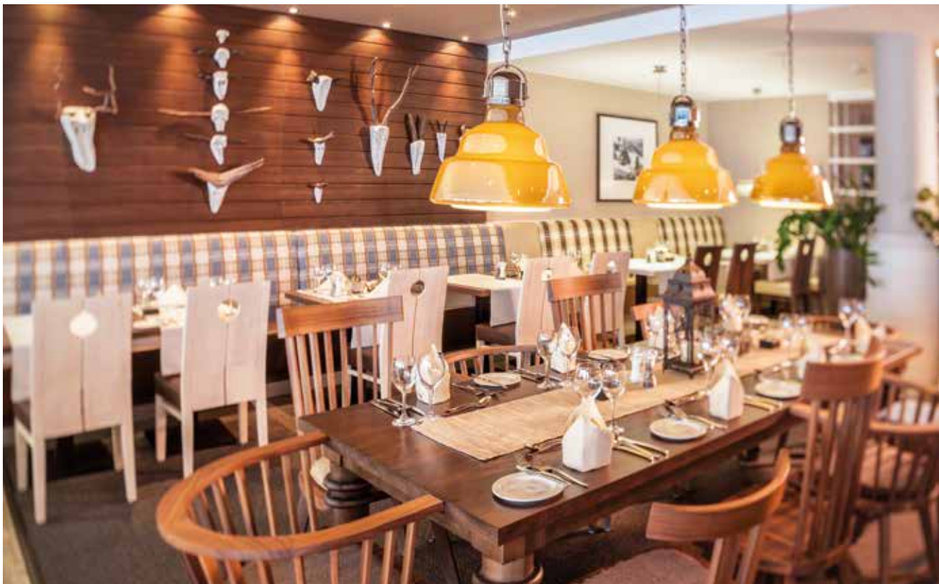
Kulinarisches Verwöhnprogramm im rustikalen Restaurant