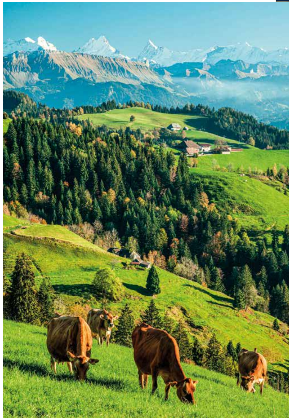
Die Emmentaler Landschaft zeigt sich idyllisch mit Weiden und Wiesen

Eine Panoramafahrt durch das liebevolle hügelige Emmental führt uns direkt in eine Schaukäserei , wo traditionelles Handwerk und modernste Technologie aufeinandertreffen. Es erwartet uns eine umfassende Erlebniswelt rund um den König der Käse . Wir werfen einen spannenden Blick auf die Käseherstellung und die Geschichte dieses Traditionsprodukts. Zudem probieren wir verschiedene Reifegrade des originalen Emmentaler Käses.