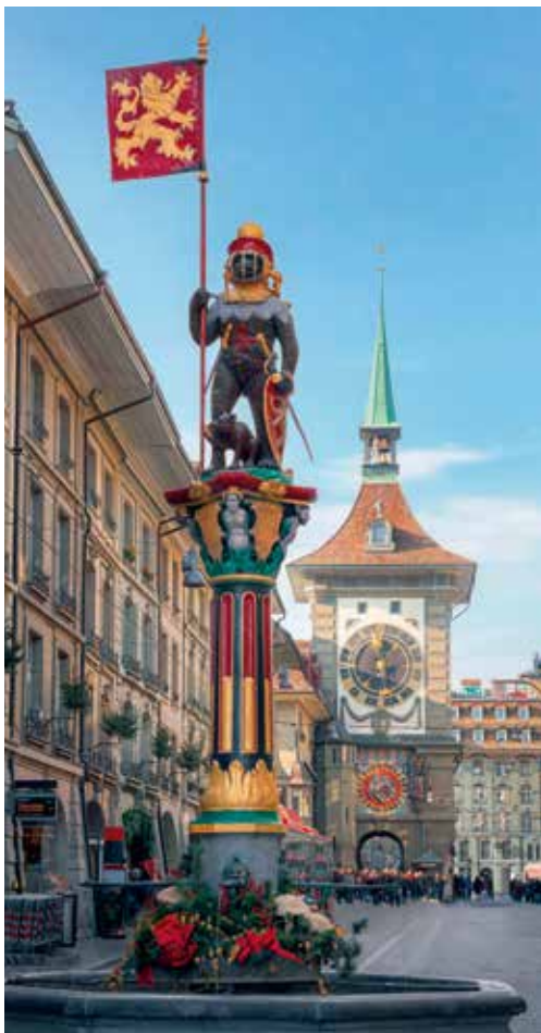
Zähringerbrunnen und Zeitlockenturm