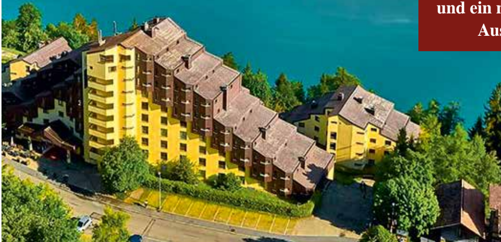
Wir genießen unvergessliche Tage mit traumhaftem Blick auf den Thunersee