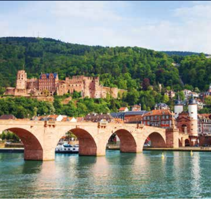
Romantische Stadt Heidelberg