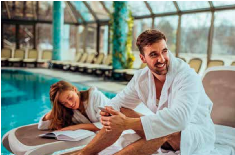
Relaxen Sie und genießen Sie am Abend ein 3-Gänge-Menü