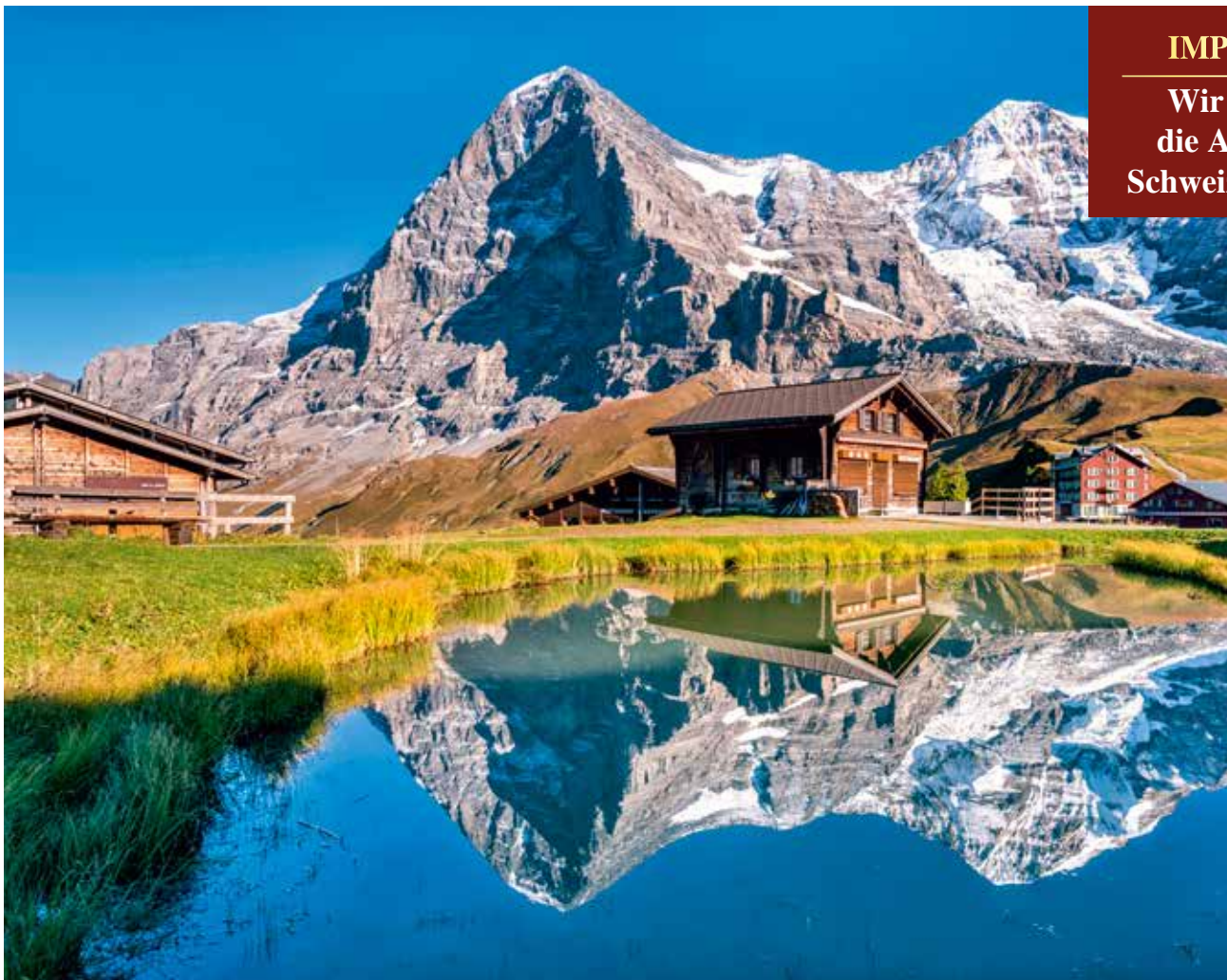
Kulisse der Schweizer Alpen an der Passhöhe Kleine Scheidegg