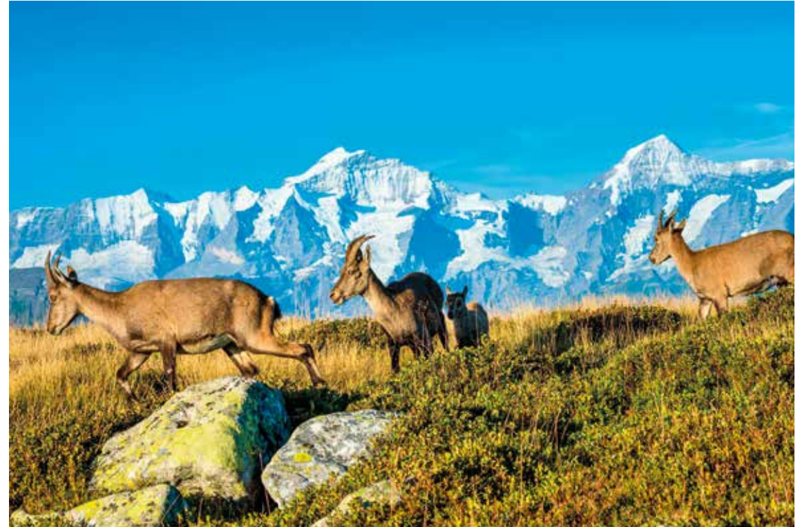
Mit etwas Glück erblickt man Steinböcke, Gämsen, Murmeltiere oder Adler