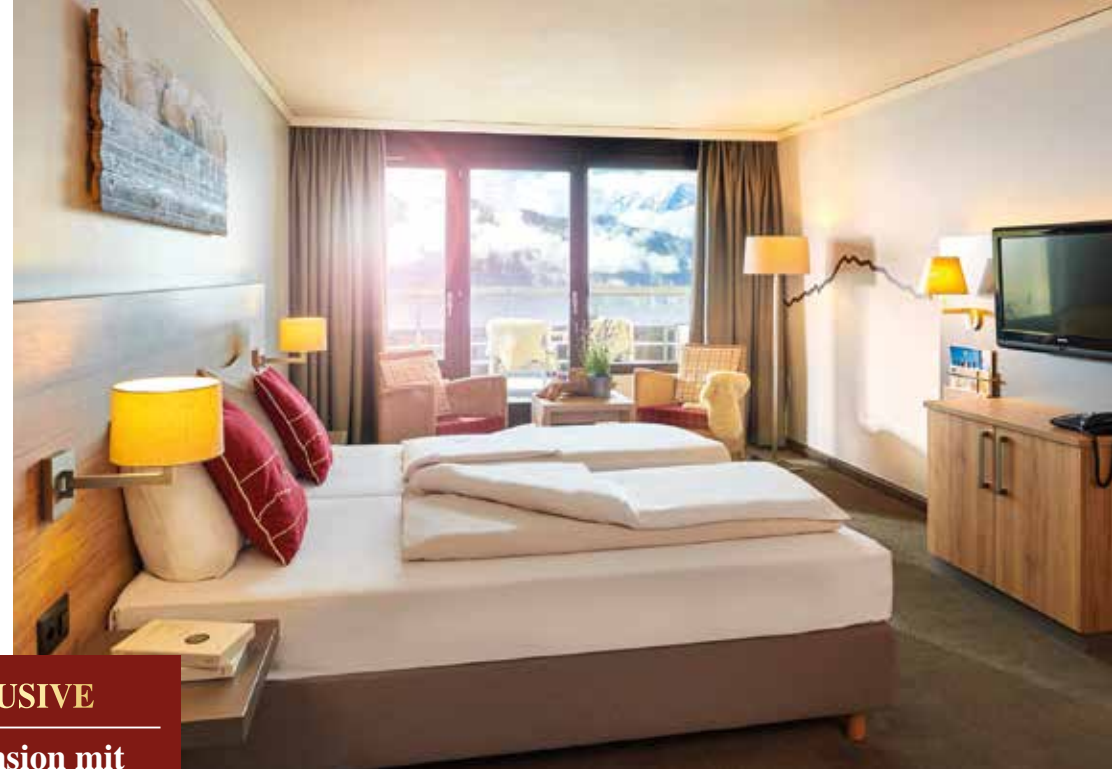
Geräumige Zimmer – gemütlich eingerichtet