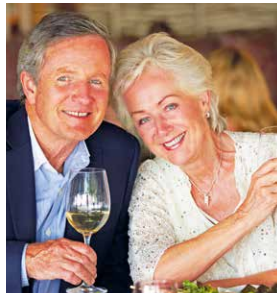
Genussvolles Speisen in Auerbachs Keller

Bedeutender Renaissancebau: das alte Rathaus in Leipzig