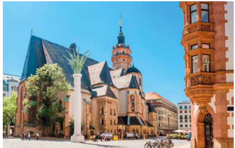
Die Nikolaikirche ist die älteste und größte Kirche in Leipzig