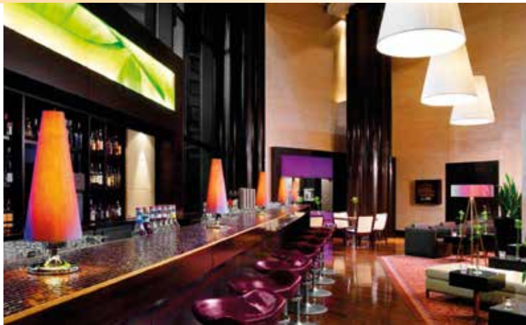
Modern-elegante Inneneinrichtung in Ihrem Hotel