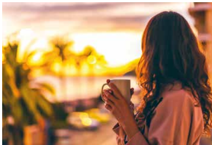
Die letzten Sonnenstrahlen des Tages genießen

Wir schlendern über den Basar, wo lokale Delikatessen zum Probieren einladen. Nach einer entspannten Teepause in einem urigen Dorfcafé setzen wir unseren Weg zum privat geführten Nomadenmuseum fort. Dort erhalten wir faszinierende Einblicke in das Leben der Yörük-Nomaden, deren Handwerkskunst besonders sehenswert ist.