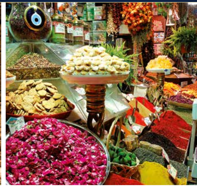
Lokale Delikatessen auf dem Basar