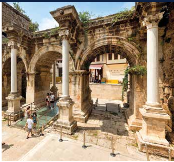
Das Hadrianstor ist das Wahrzeichen Antalyas