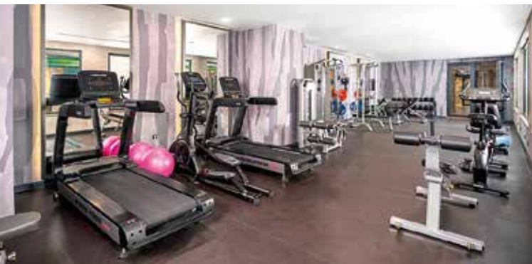
Im Spa-Bereich gibt es einen kleinen Fitnessraum und einen Ruheraum zum Relaxen