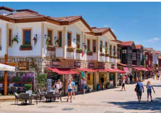
Belebte Altstadt von Side

Wir schlendern über den Basar, wo lokale Delikatessen zum Probieren einladen. Nach einer entspannten Teepause in einem urigen Dorfcafé setzen wir unseren Weg zum privat geführten Nomadenmuseum fort. Dort erhalten wir faszinierende Einblicke in das Leben der Yörük-Nomaden, deren Handwerkskunst besonders sehenswert ist.