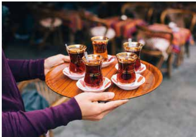
Gemeinsam Tee trinken symbolisiert Verbundenheit