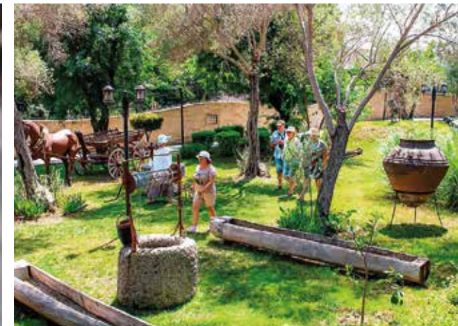
Museumsgelände mit originalen Exponaten