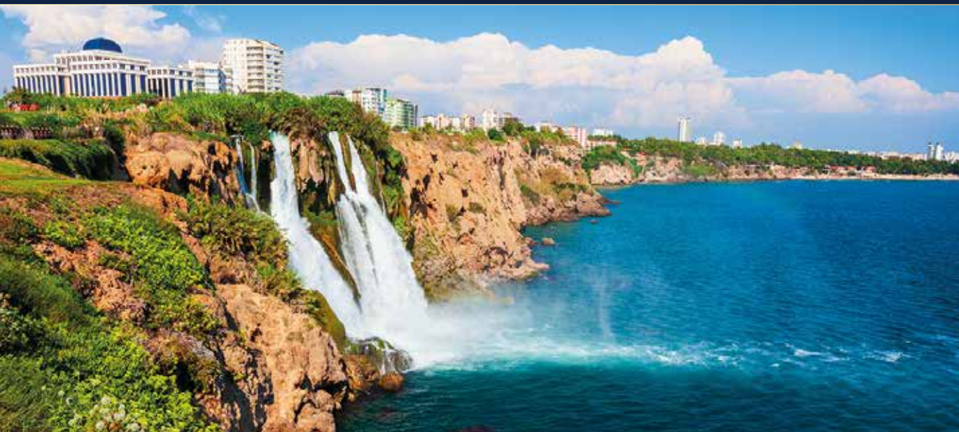
Der Untere Düden-Wasserfall fließt aus 45 Metern Höhe hinab ins Meer