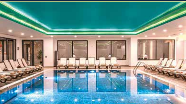
Schwimmen im beheizten Innenpool und ein entspannender Saunagang revitalisieren Körper und Geist