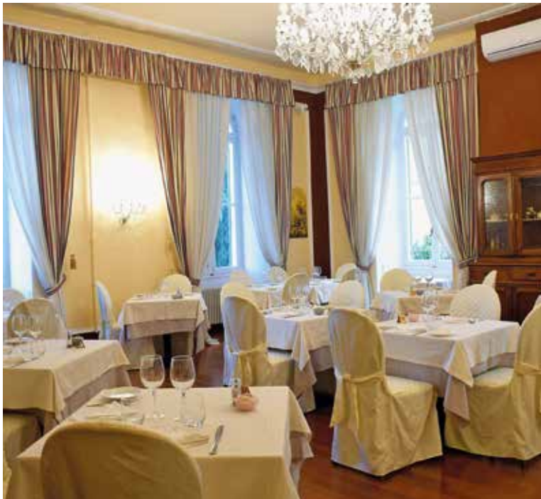
Genießen Sie Zeit zu zweit und die italienisch-mediterrane Küche im klassischen Restaurant