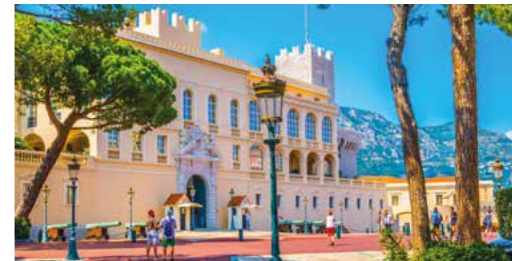
Offizieller Sitz des Fürsten von Monaco

Monte Carlo, das glamouröse Herz von Monaco, bietet eine Vielzahl von Freizeitaktivitäten. Das berühmte Casino ist für Glücksspiel und als Tummelplatz der Reichen und Schönen bekannt.