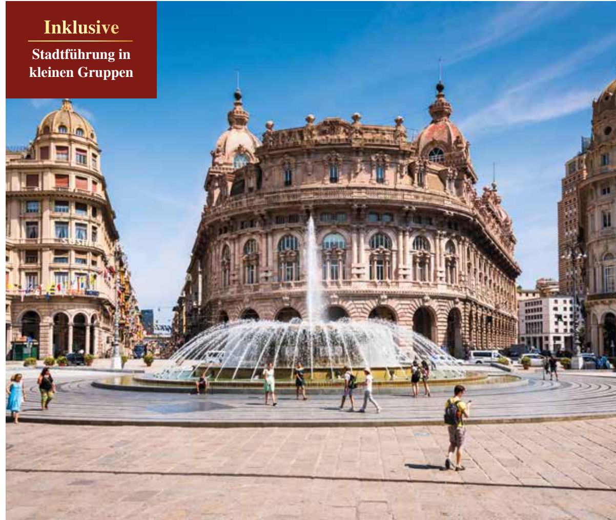
Die Piazza de Ferrari mit beeindruckender Brunnenanlage im Zentrum – ein beliebtes Fotomotiv