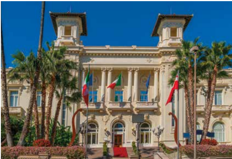
Das Casino di Sanremo

Gemeinsam besuchen wir mit unserer deutschsprachigen Reiseleitung die Blumenstadt. Das überaus lebhaftes Zentrum ist geprägt von spätmittelalterlicher Baukunst, schmalen Gässchen, dem berühmten Teatro Ariston, langen Palmenpromenaden, romantischen kleinen Plätzen und vielen eleganten Boutiquen.