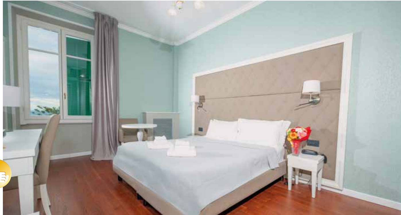
Moderne Einrichtung, Beispielzimmer unserer gebuchten Kategorie mit Meerblick