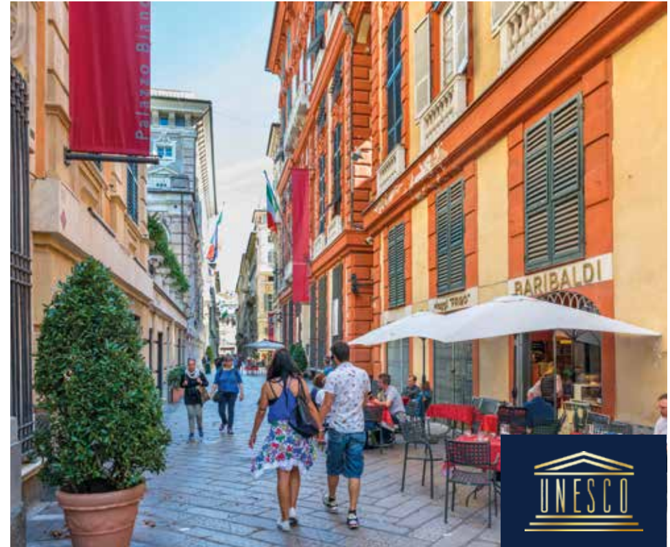
Via Garibaldi: eine der bedeutendsten Straßen Genuas

Genua hat noch viel mehr zu bieten. Unser Reiseleiter hält einige Tipps für Sie bereit, zum Beispiel den Aussichtspunkt Spianata Castello, einen Besuch im Aquarium oder eine Ausstellung im Palazzo Ducale.