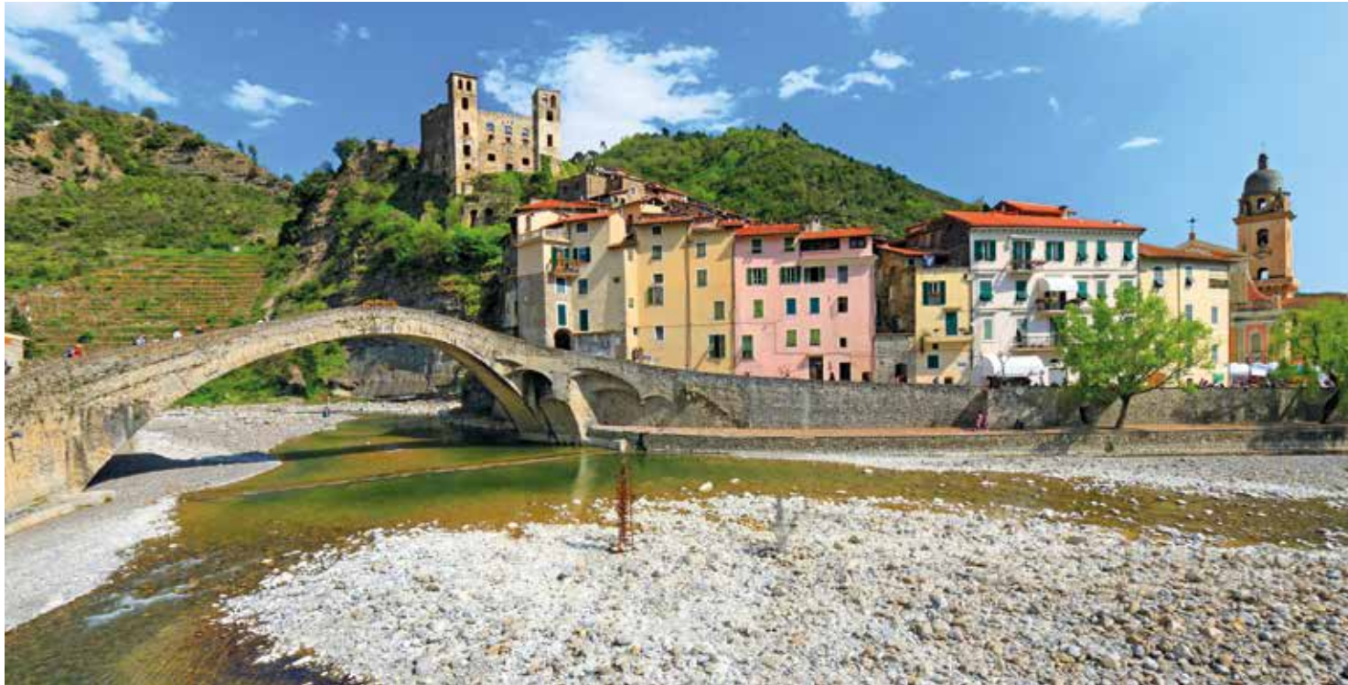
Die Steinbrücke „Ponte Vecchio“ über die Nervia ist ein architektonisches Meisterwerk aus dem 15. Jahrhundert