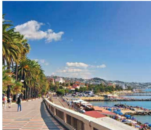
Spaziergang entlang der Strandpromenade