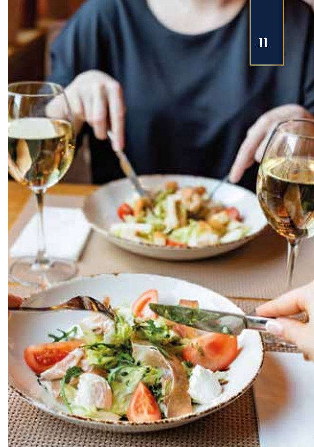
INKLUSIVE – 3-Gänge-Mittagsmenü

Zudem tauchen wir in eine Welt voller Rosen und Lavendel ein und erfahren mehr über den Anbau der Pflanzen, insbesondere den der für das Land typischen Damaszener-Rosensorte, sowie die Kunst der Ölherstellung. Eine Verkostung von Rosenlikör und Lavendellimonade rundet das Erlebnis ab.