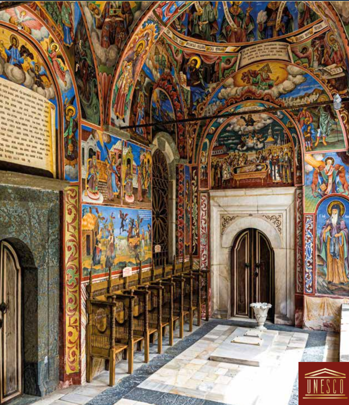
Beeindruckende bunte Freskenmalereien im Säulengang des Klosters