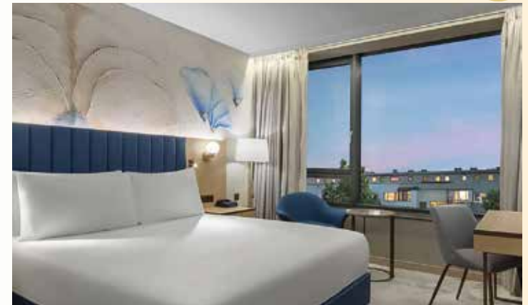
Alle Zimmer vereint ein elegant-komfortabler Stil