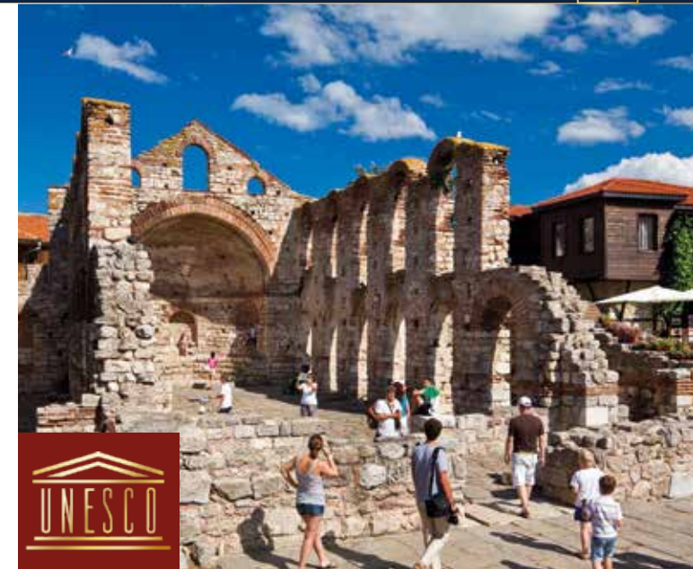
Geschichtsträchtige Altstadt von Nessebar