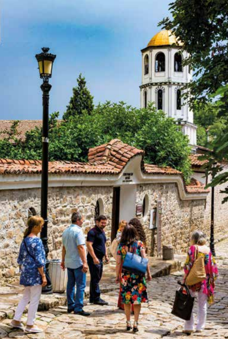
Geteilte Gruppen – Stadtführung in Plowdiw