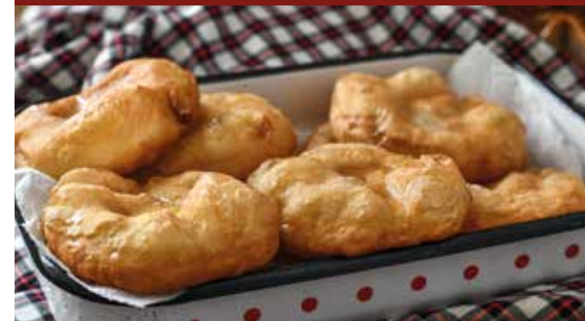
Mekiza, traditionelles bulgarisches Gebäck

Inmitten der bulgarischen Bergwelt Unser Ausflug in den Nationalpark Rila ist für Naturliebhaber und Kulturfans ein unvergessliches Erlebnis. Ein absolutes Highlight ist der Besuch des berühmten Klosters Rila, UNESCO-Weltkulturerbe und bedeutender spiritueller Ort in Bulgarien. Das Kloster beeindruckt mit reich verzierter Architektur, kunstvollen Freskenmalereien und einer friedlichen Atmosphäre. Hinter dem Kloster befindet sich eine kleine Bäckerei, wo wir mit dem traditionellen Gebäck Mekiza inklusive eines Getränks verköstigt werden (Limonade oder Ayran).