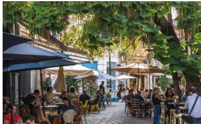
Kapana ist das Künstler- und Ausgehviertel