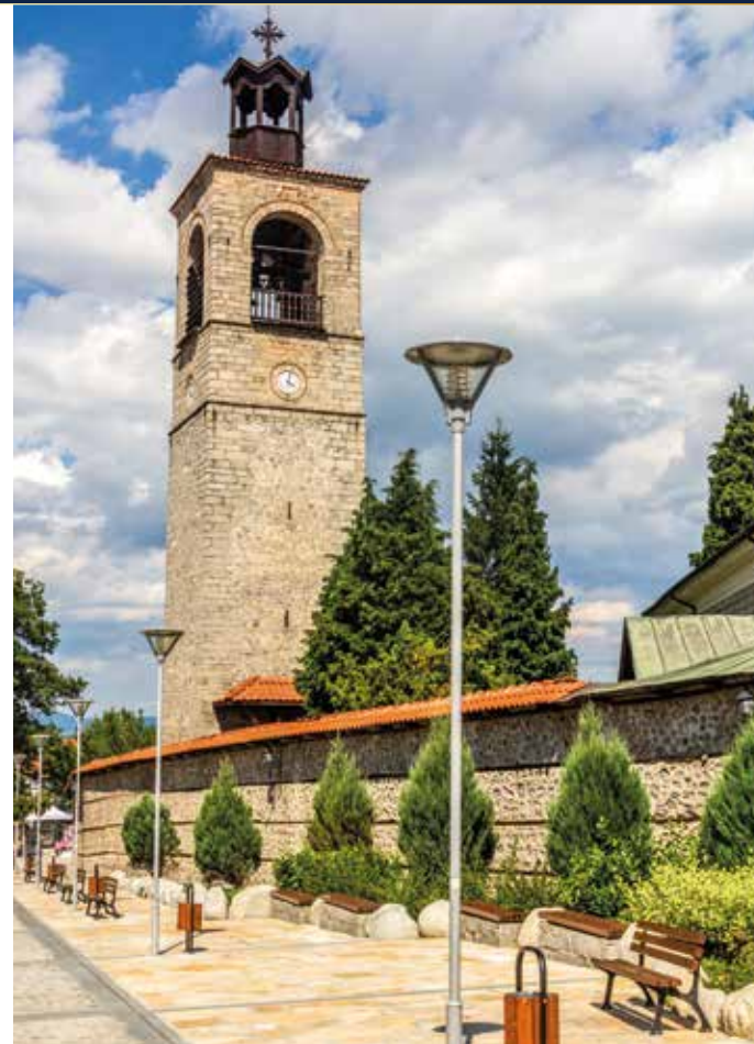
Im Wintersportort Bansko flanieren wir entlang traditioneller Häuser und an der Kirche „Sveta Troitsa“ vorbei