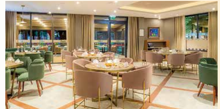
Das Hotel ist im Art-déco-Stil eingerichtet