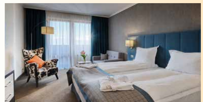
Zimmerbeispiel im „Spa Resort St. Ivan Rilski“