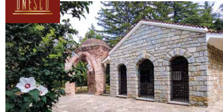
Wandmalerei im Grabmal von Ksanlak