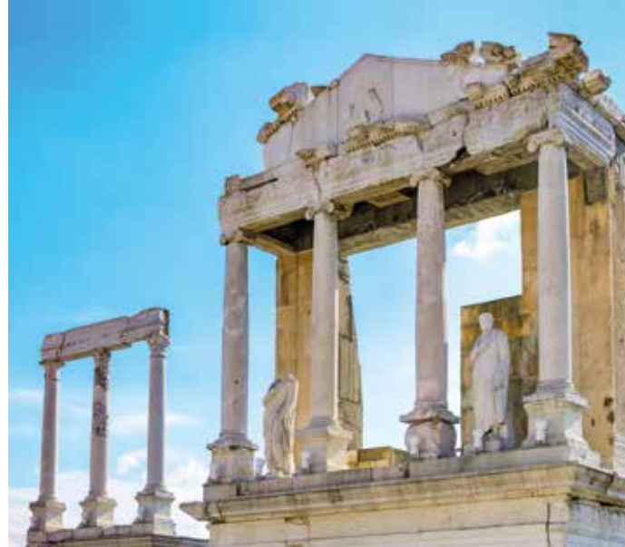
Auf antiken Spuren der Römer

Unsere Fahrt beginnt in Avramovo, am höchstgelegenen Bahnhof des Balkans, der 1.268 Meter über dem Meeresspiegel liegt. Während unserer romantischen Fahrt durch das Rhodopengebirge lassen wir uns vom altertümlichen Charme des Zuges verzaubern. Durch Wälder und Tunnel, vorbei an steilen Felswänden und uralten Bahnhöfen, erreichen wir den Kurort Welingrad. Eine der schönsten Bahnstrecken des Landes erfreut Zug- und Naturliebhaber gleichermaßen.