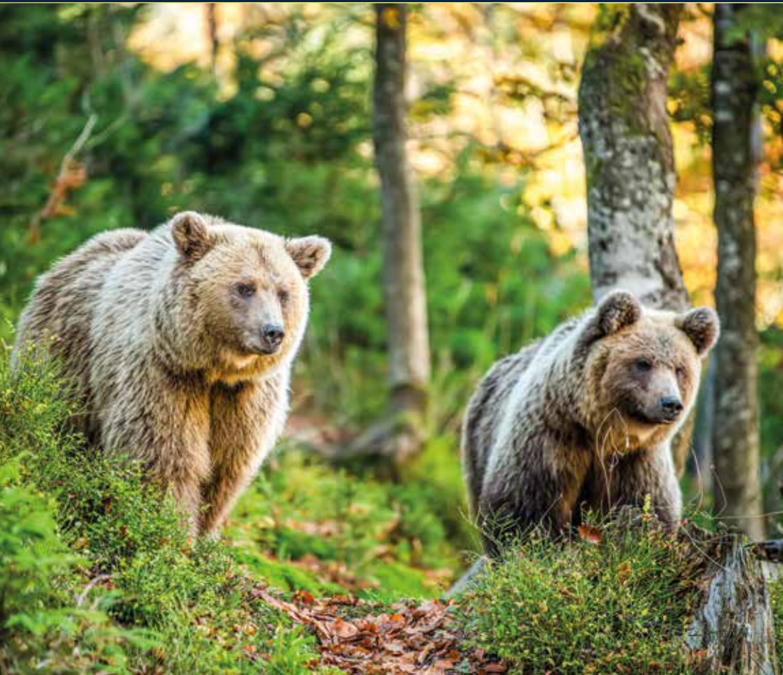
Braunbären stehen unter dem Schutz des bulgarischen Naturschutzgesetzes