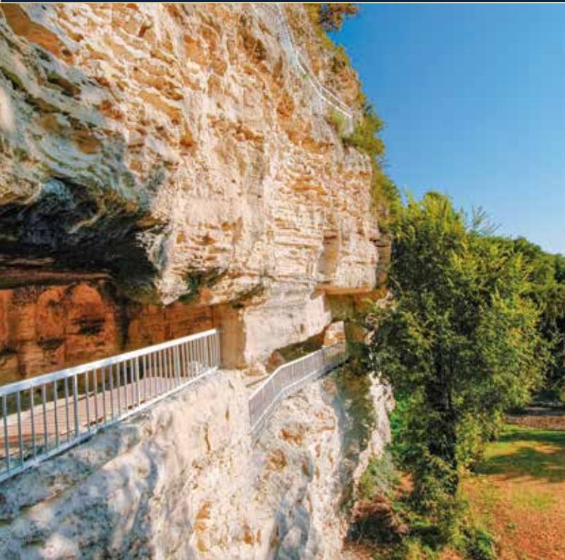
Wir erkunden die Klosterhöhlen und genießen die Aussicht