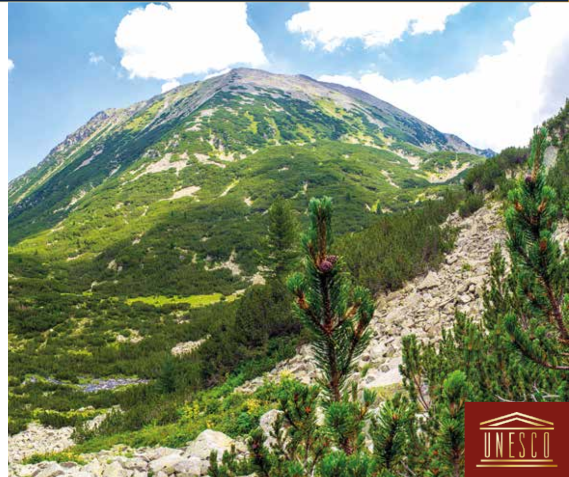
Der Nationalpark Pirin beeindruckt mit seiner imposanten Bergwelt