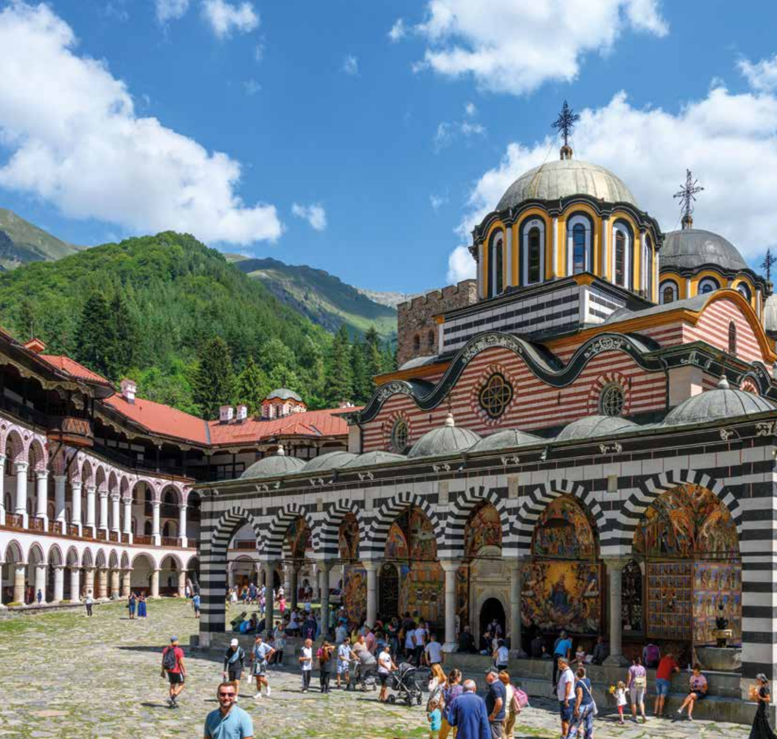
Unsere Klosterbesichtigung bietet interessante Einblicke in die reiche Geschichte und die Kultur des Landes