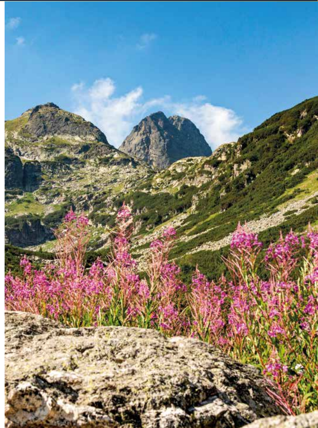
Der Nationalpark Rila ist landschaftlich von hohen Bergen geprägt