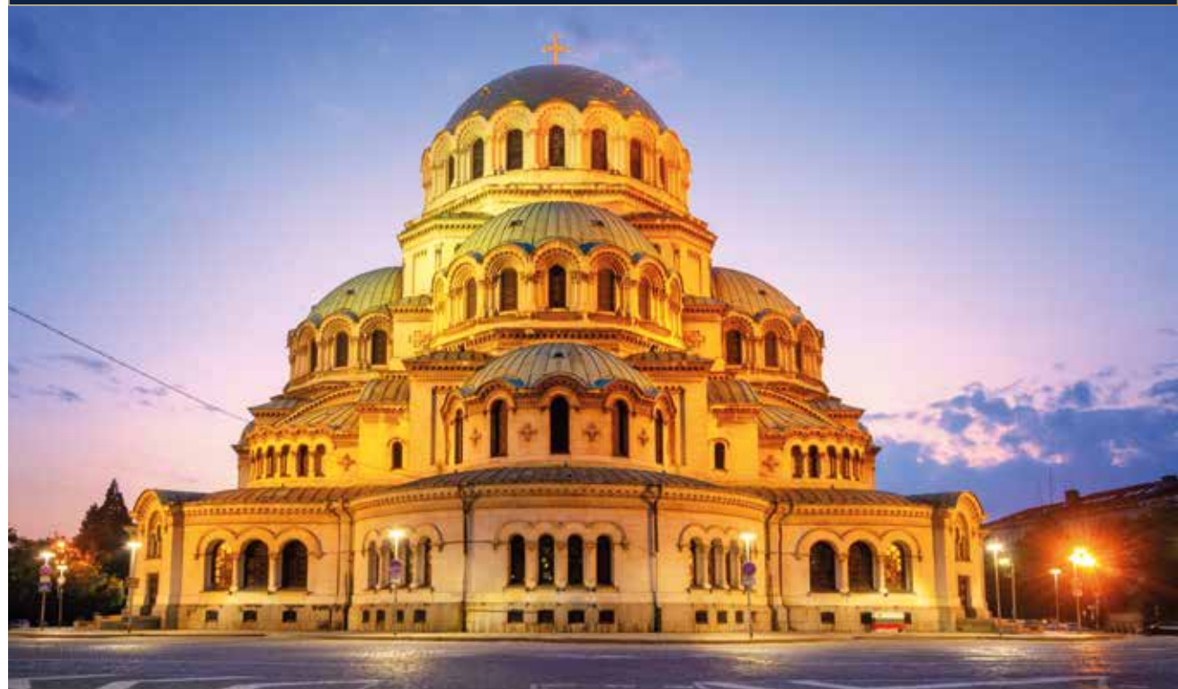
Die Alexander-Newski-Kathedrale ist ein bedeutendes kulturelles Wahrzeichen des Landes