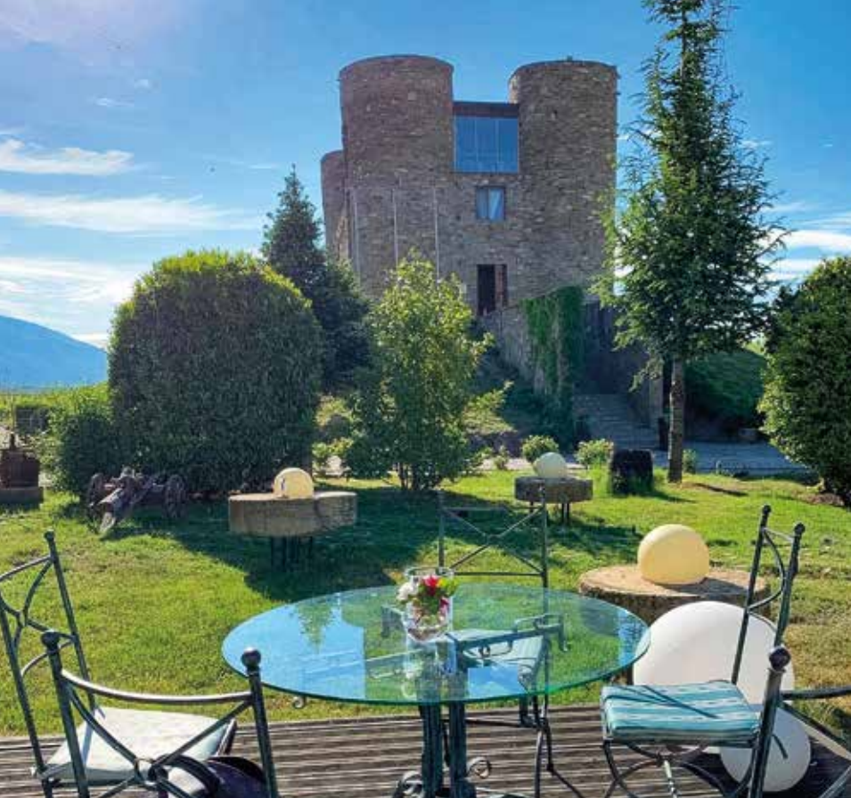
INKLUSIVE – Verkostung bulgarischer Weine