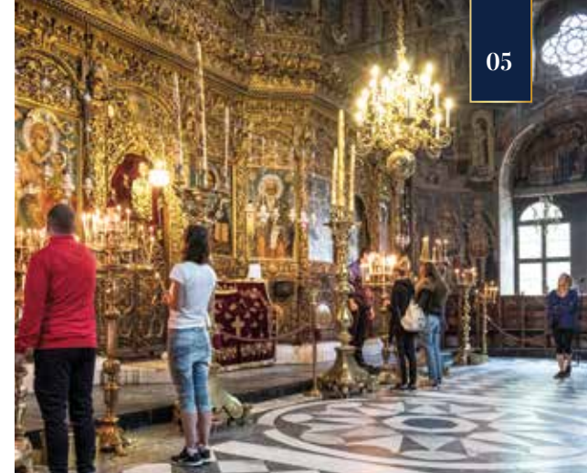
Eine spirituelle Atmosphäre empfängt uns