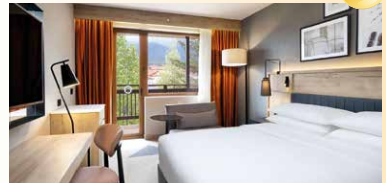
Zimmerbeispiel im „Four Points by Sheraton Bansko“