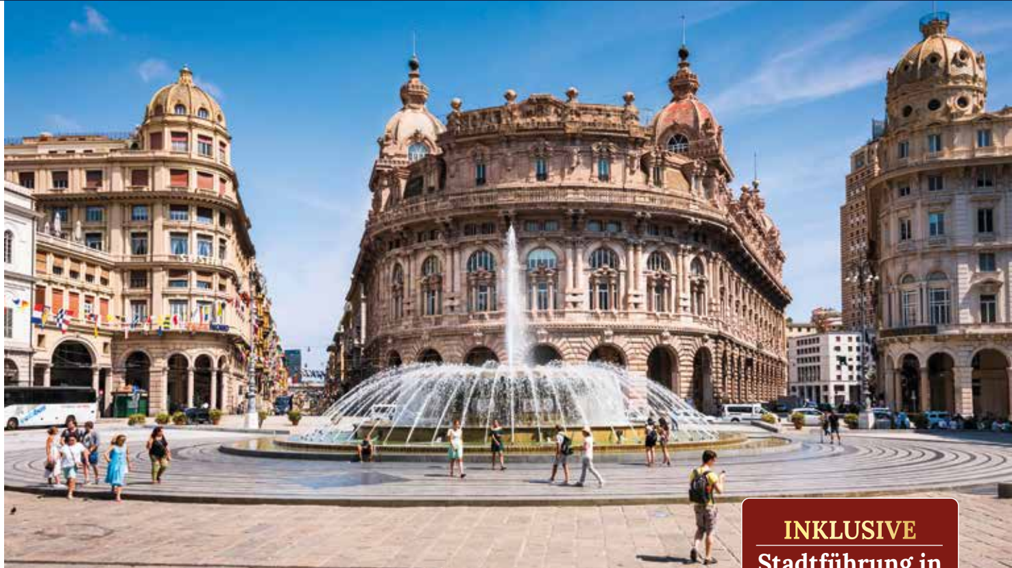
Die Piazza de Ferrari mit beeindruckendem Brunnen – ein beliebtes Fotomotiv

Genua begeistert durch seinen historischen Hafen. Er ist von prächtigen Palästen und engen Gassen umgeben, die das reiche maritime Erbe der Stadt widerspiegeln. Auf unserer Stadtführung machen wir uns ein Bild von seiner Schönheit und Geschichte. Wir bummeln durch die Via Garibaldi, die zum UNESCO-Weltkulturerbe gehört. Am Hauptplatz Piazza de Ferrari bewundern wir die Brunnenanlage. Die Kathedrale San Lorenzo ist ein Musterbeispiel für romanische und gotische Architektur. Im Porto Antico liegt das alte Piratenschiff „Neptune“. Diese spanische Galeone wurde ursprünglich als Kulisse für den Film „Piraten“ von Roman Polanski gebaut (Besichtigung als Freizeittipp). Am Hafen befindet sich eines der größten Aquarien Europas.