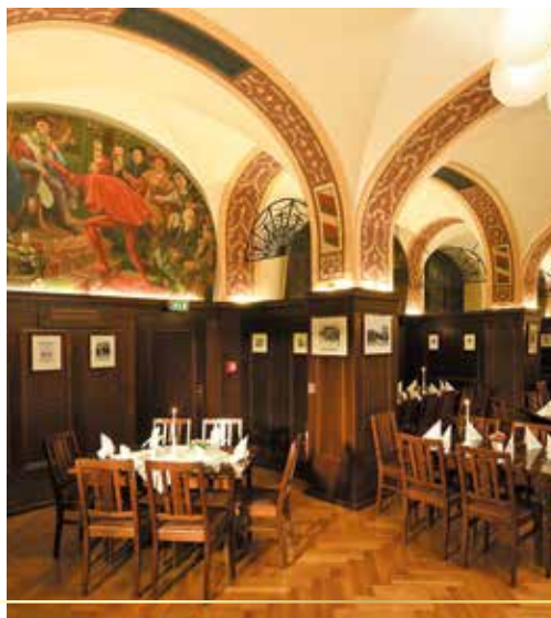
▲ Abendessen im Auerbachs Keller