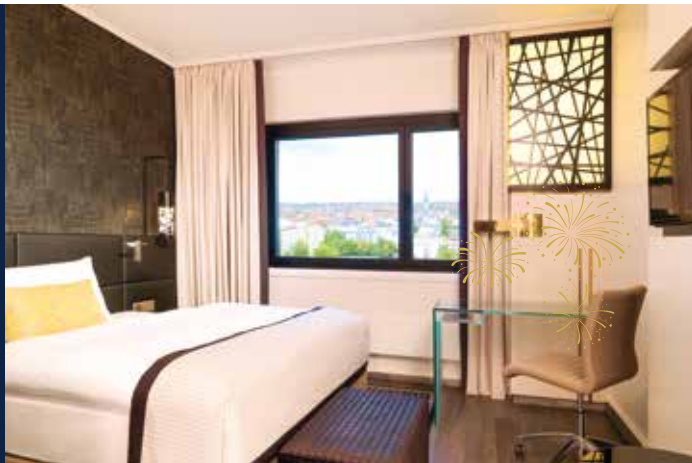
▲ Modern-elegante Inneneinrichtung in Ihrem Hotel