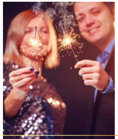
▲ Silvestergala im The Westin