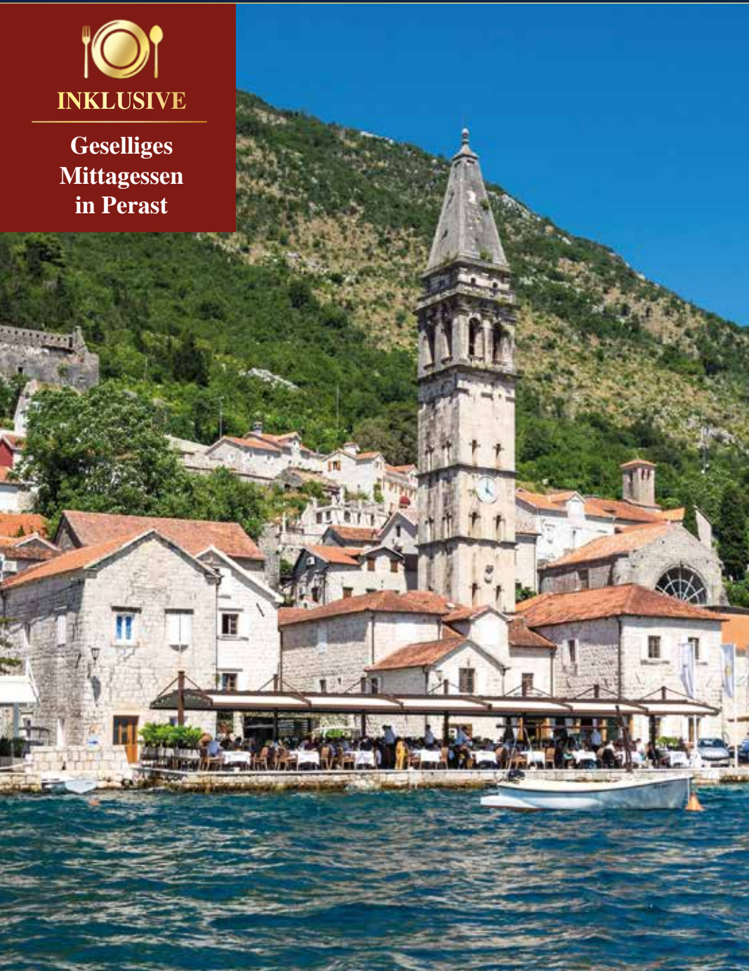
Beeindruckender Glockenturm im venezianischen Baustil am Ufer von Perast