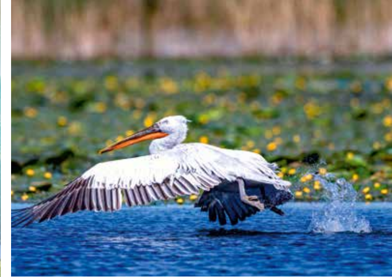
Pelikan auf Fischfang am Skutarisee