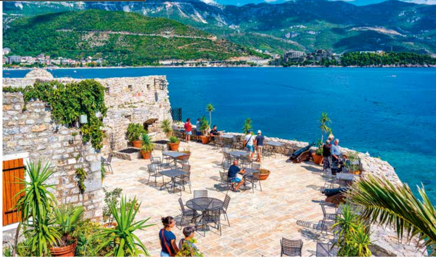
Wunderbarer Ausblick von der Cafétterasse der alten Zitadelle