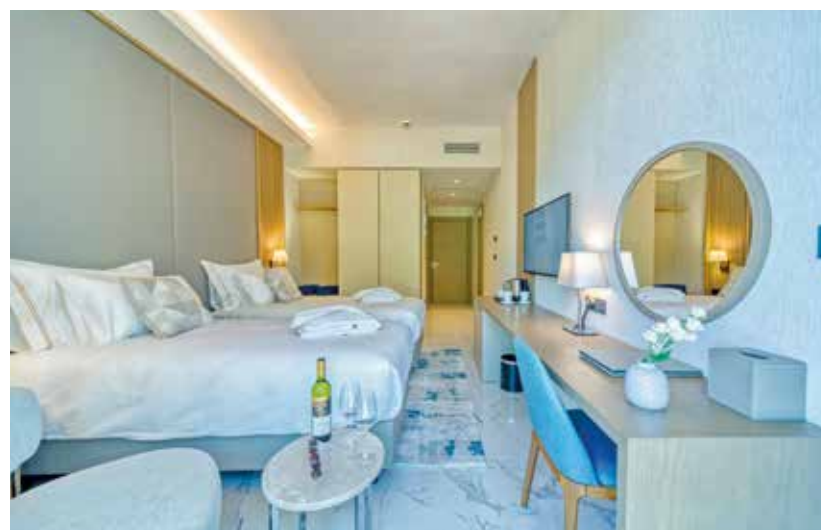
Unser Resort ist stilvoll eingerichtet und bietet uns komfortable Doppelzimmer