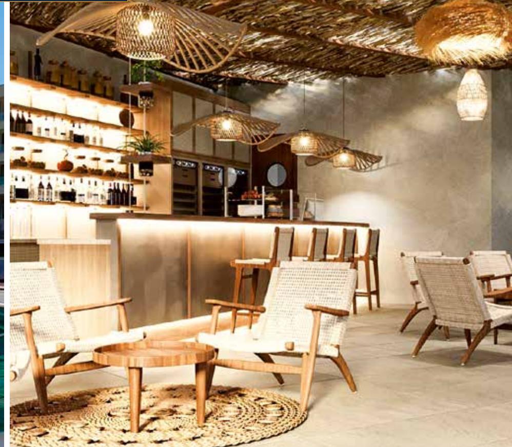
Unser 5-Sterne-Resort bietet zahlreiche Rückzugsorte zum Entspannen und gemütlichen Verweilen am Strand, am Pool oder in einer der stilvollen Bars