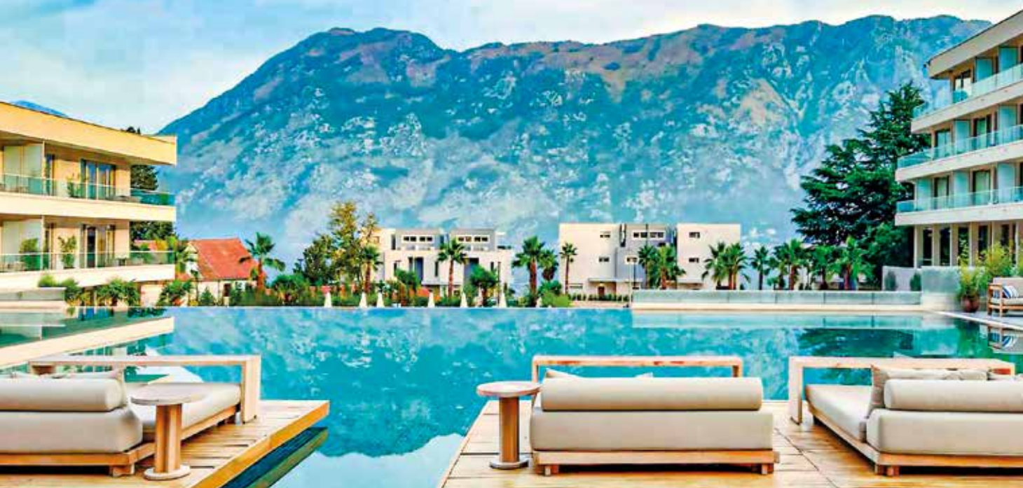
Entspannen Sie direkt an der malerischen Bucht von Kotor – einer der schönsten Ecken Montenegros