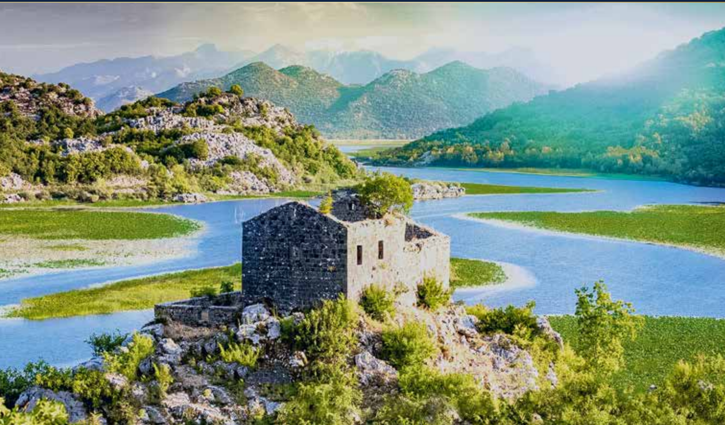
Der von Bergen und grünen Hügeln umringte himmelblaue See erscheint wie auf Leinwand gemalt