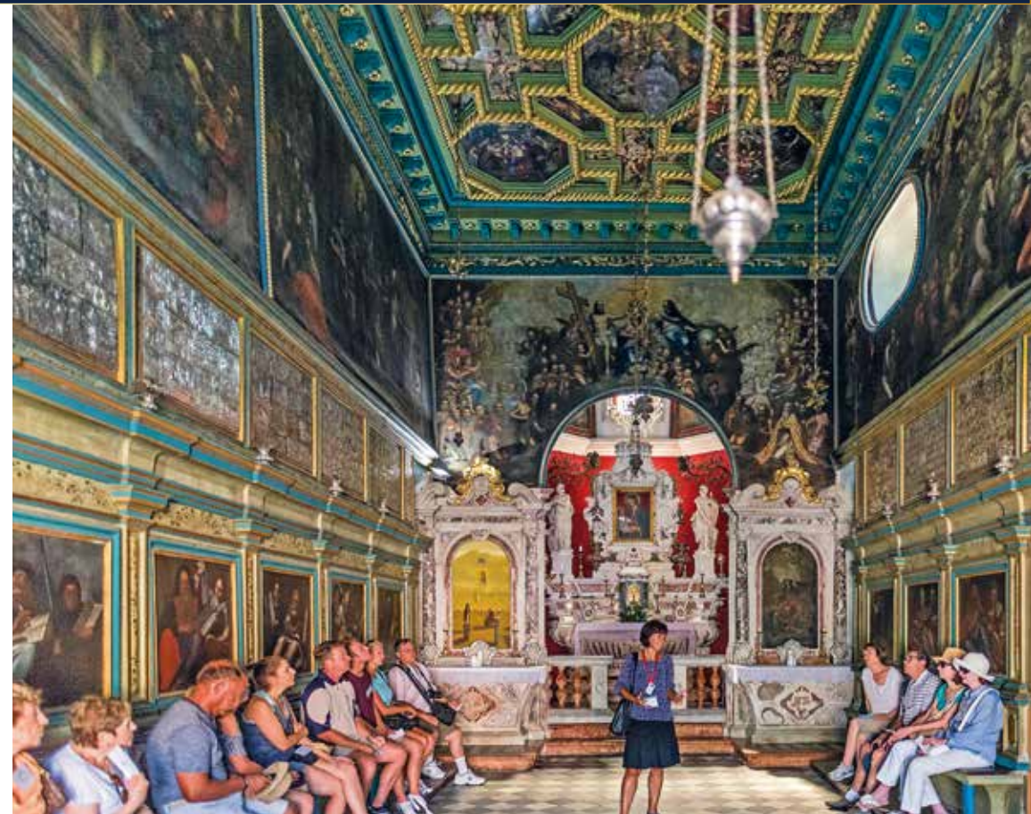
Die Wallfahrtskirche beinhaltet kostbare Gemälde