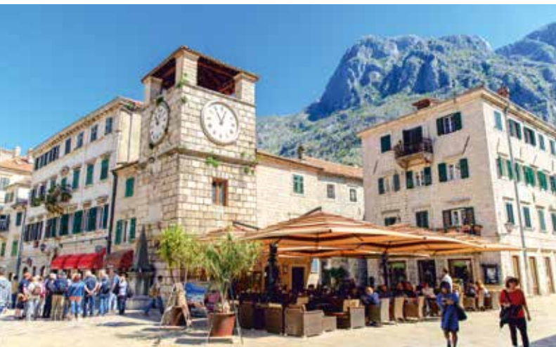
Hauptplatz in der Altstadt von Kotor