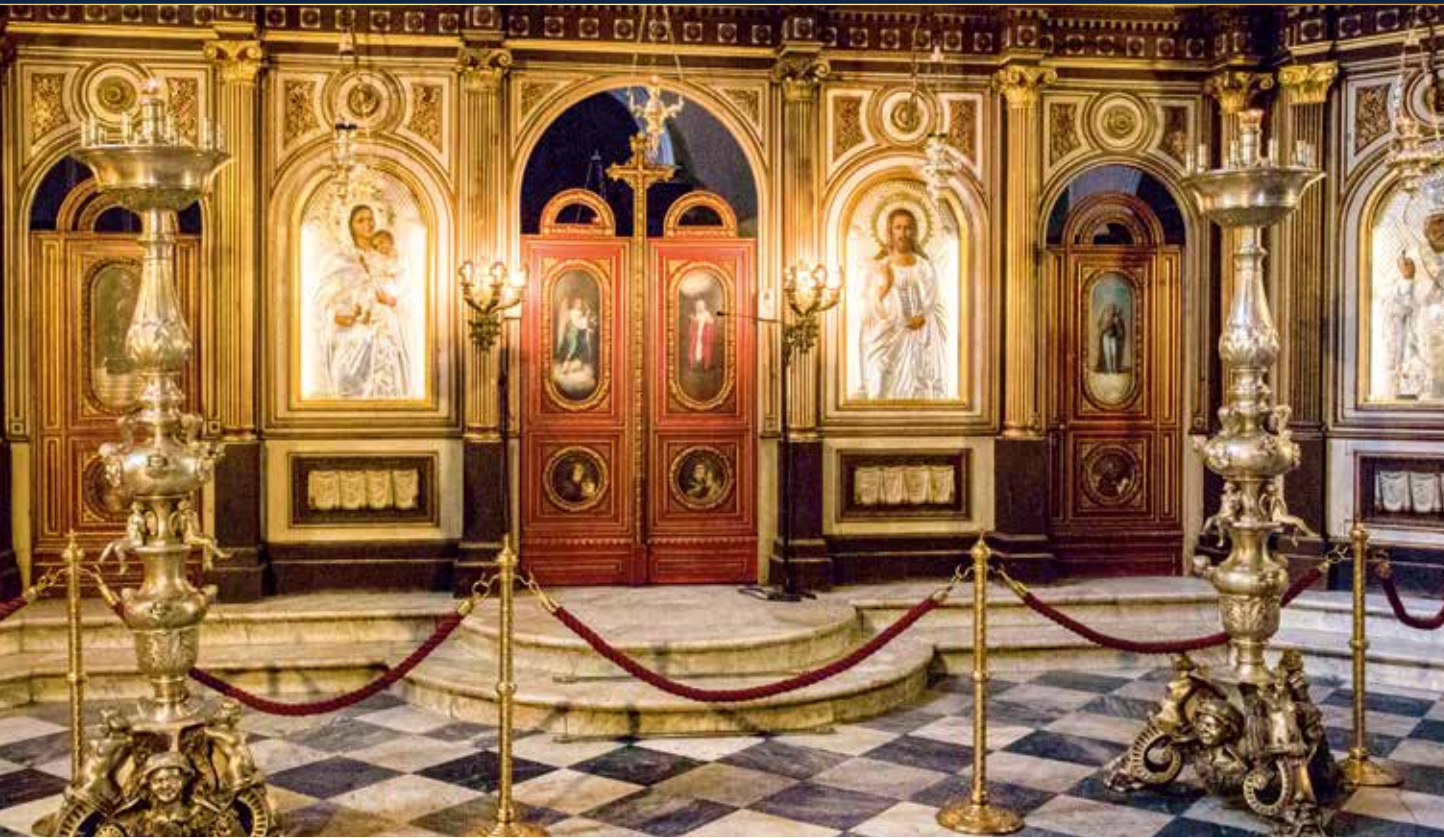
Wir besichtigen die beeindruckende Schatzkammer in der Sankt-Tryphon-Kathedrale