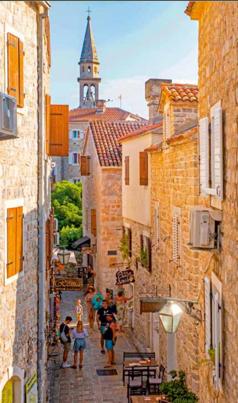
In Budva wandeln wir auf den Spuren römischer, venezianischer und byzantinischer Eroberer