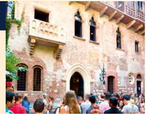
Balkon von Romeo & Julia in Verona

Sprechen Sie uns für eine detaillierte Einschätzung gerne an unter: 05751-926 399 80