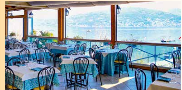
Das Restaurant Italia mit Ausblick auf den Lago Maggiore

Zur Mittagszeit verweilen wir auf der Isola dei Pescatori in einem am Wasser gelegenen traditionsverbundenen Restaurant. Wir genießen ein regionales, mit Liebe zubereitetes 3-Gänge-Menü . Dazu werden uns Wein und Wasser sowie ein typisch italienischer Espresso serviert – buon appetito!