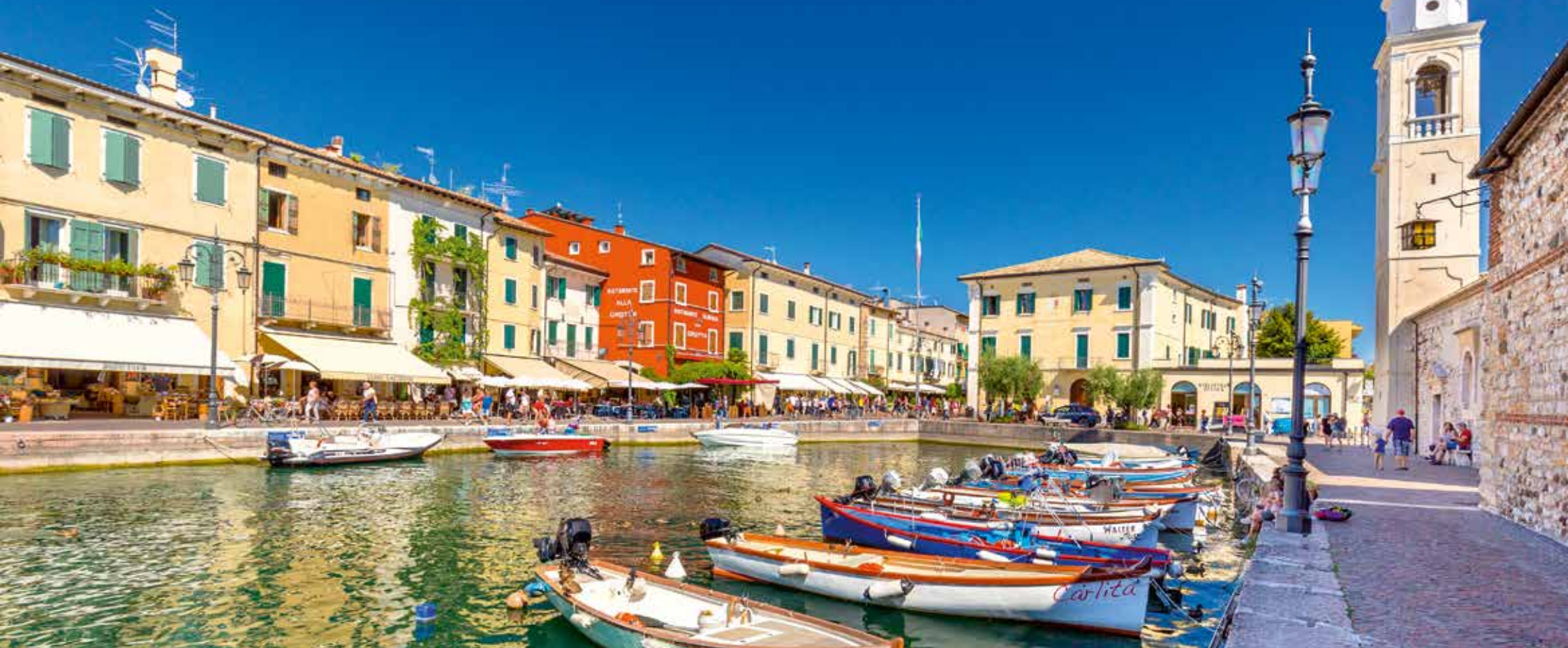
Lazise beeindruckt mit seinen schönen Promenaden und ist Teil der beliebten Weinstraße des Gardasees