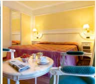
Das Hotel ist klassisch eingerichtet