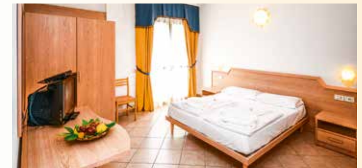
Jedes Zimmer ist individuell eingerichtet