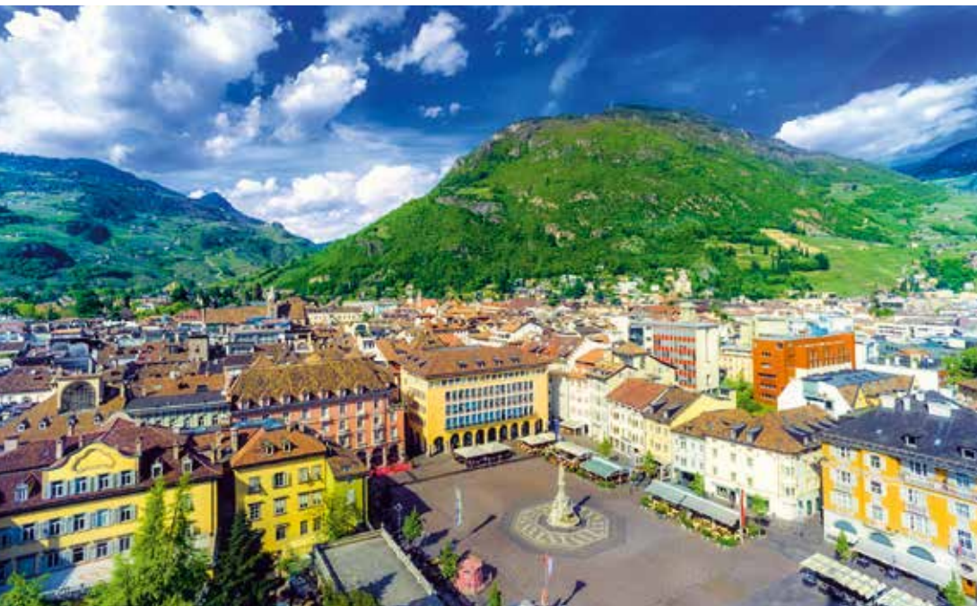
Blick auf das Herz von Bozen, den Walther-von-der-Vogelweide-Platz

STADT- FÜHRUNGEN IN KLEINEN GRUPPEN maximal 22