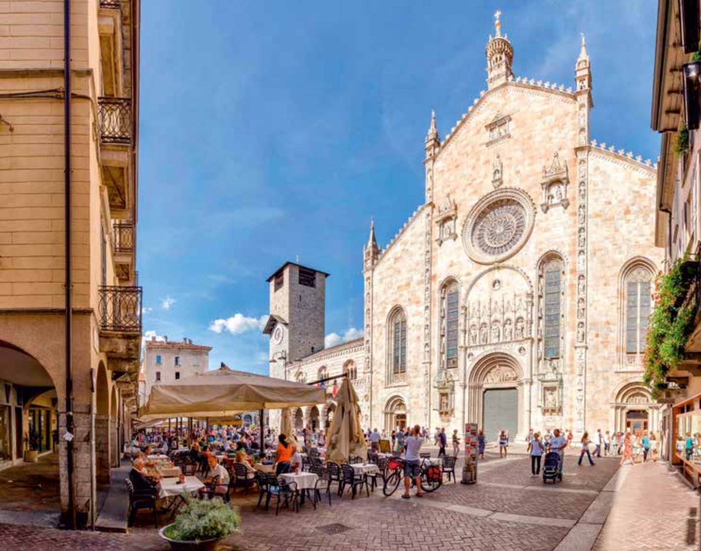
Die reich verzierte, 45 Meter hohe Domfassade aus weißem Marmor erstrahlt im Sonnenlicht