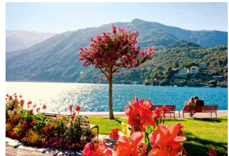
Auszeit am Lago Maggiore in der Schweiz