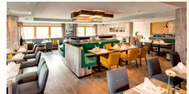
Frühstücken im gemütlichen Ambiente