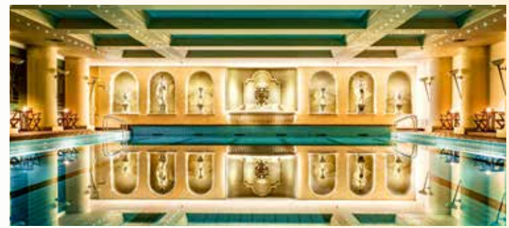
Kostenfreie Nutzung des Schwimmbads im Wellnessbereich