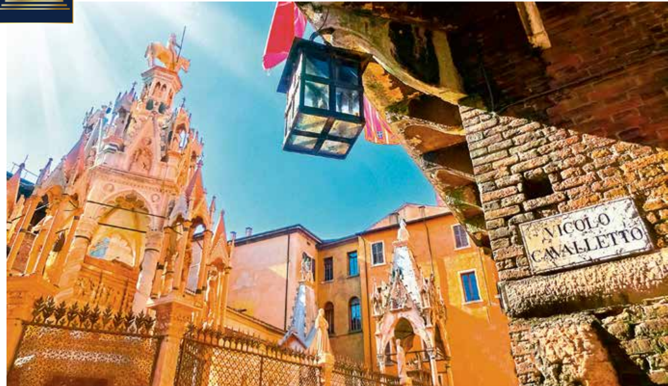
Freizeitipp: Die Scaliger-Gräber gehören zu den weltweit bemerkenswertesten Beispielen der Gotik