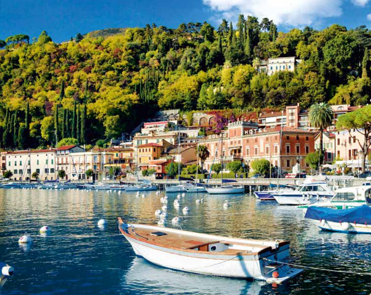
Blick auf den Hafen von Toscolano-Maderno am Gardasee