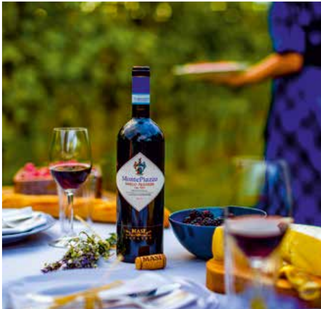
Wir verkosten fruchtige regionale Rotweine

Das Anwesen Serego Alghieri befindet sich seit 1353 im Besitz der direkten Nachkommen des Dichters Dante . Die Besichtigung führt uns durch die Geschichte der adligen Grafenfamilie. Wir spazieren durch den Garten und in den Weinbergen des Guts, besichtigen den historischen Reifekeller und verkosten drei edle Weine sowie regionale Käsesorten mit Grissini .