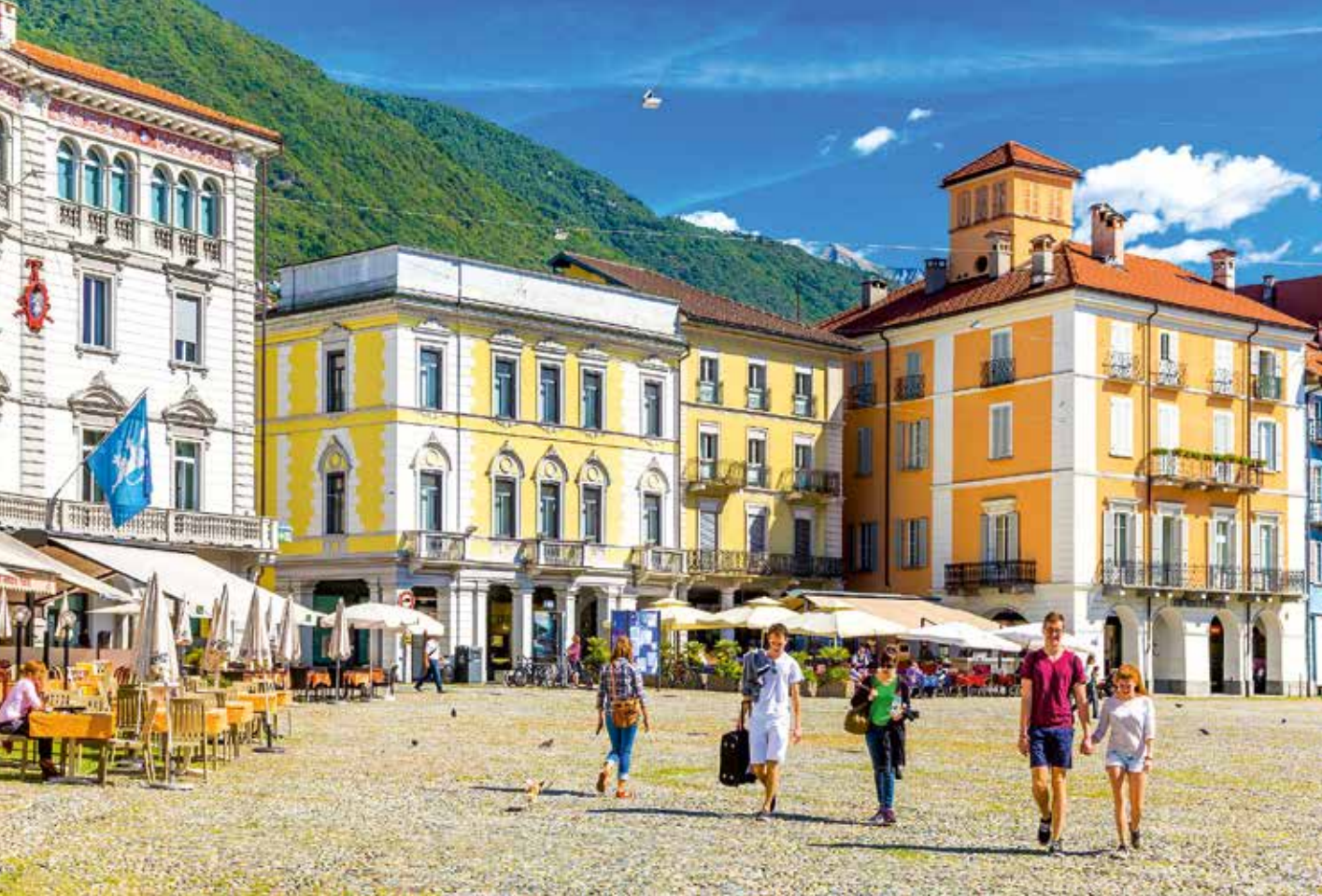
Die Piazza Grande in Locarno ist einer der größten und bekanntesten Stadtplätze der Schweiz