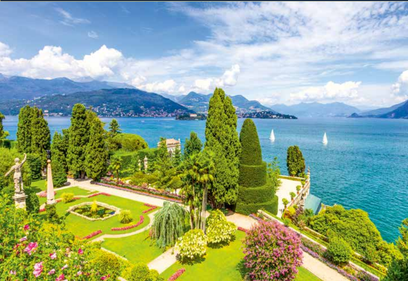
Wir genießen umwerfende Ausblicke von der Isola Bella auf den Lago Maggiore