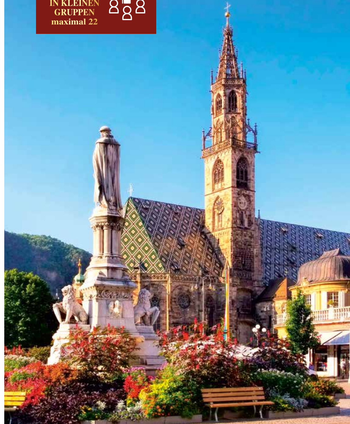
Der Dom Maria Himmelfahrt ist das Wahrzeichen der Südtiroler Hauptstadt Bozen