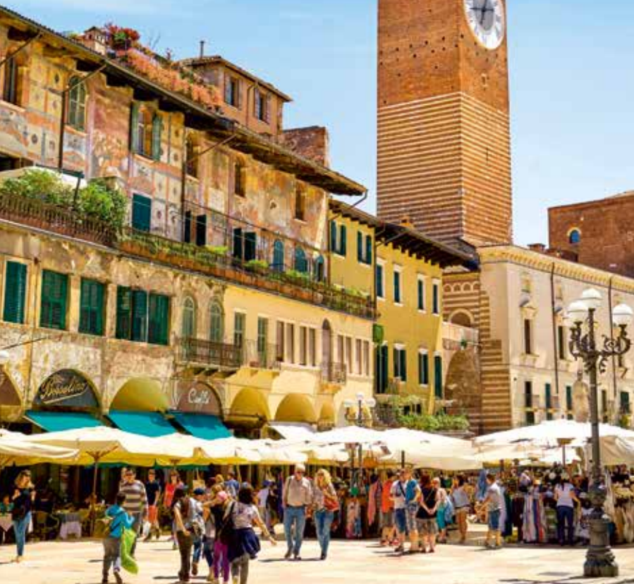
Die Piazza delle Erbe lockt mit zahlreichen Marktständen