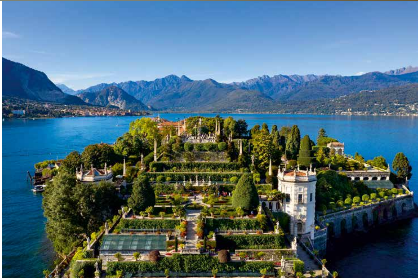
Die Isola Bella mit beeindruckender Gartenanlage diente der Familie Borromeo als Repräsentationsort für hochrangige Gäste, z. B. Napoleon Bonaparte im Jahr 1797