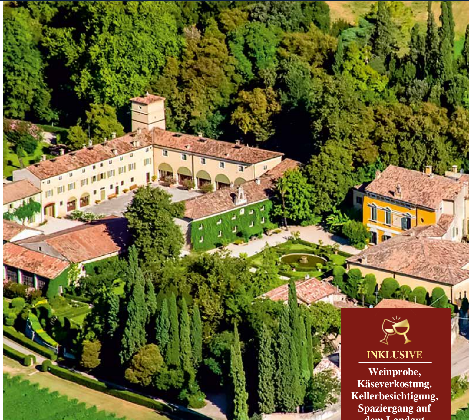
Inmitten von Zypressen liegt das geschichtsträchtige Weingut Serego Alghieri