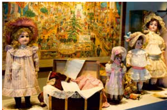
Das Puppenmuseum in der Rocca di Angera dokumentiert den Wandel des Spielzeugs