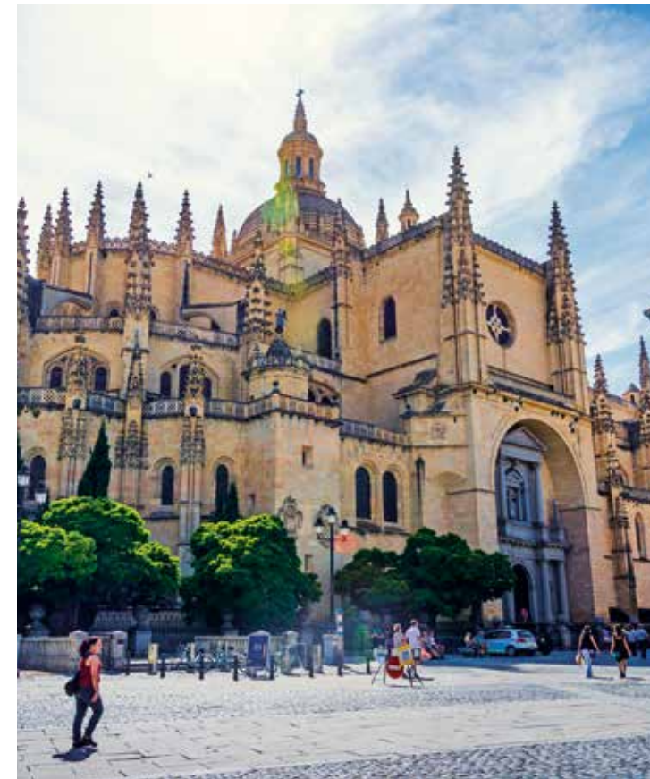
Die Kathedrale von Segovia sehen wir von außen