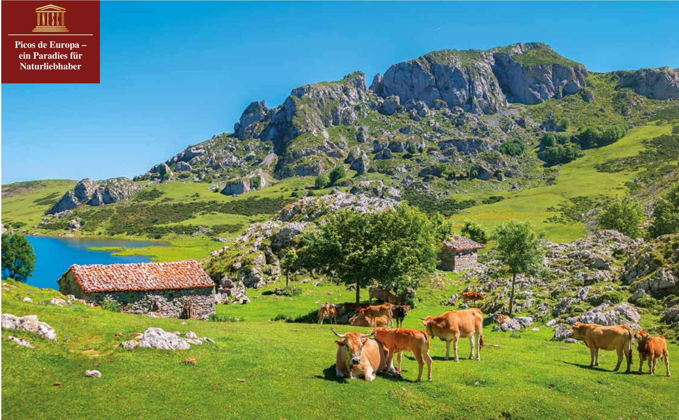
Das eindrucksvolle Gebirge ist für seine atemberaubende Landschaft, steilen Klippen, tiefen Schluchten und grünen Täler bekannt

Picos de Europa – ein Paradies für Naturliebhaber