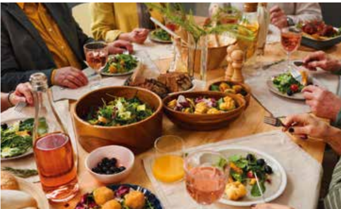
Tapas – spanische Esskultur: Genießen Sie unsere Einladung zum 3-Gänge-Abendessen