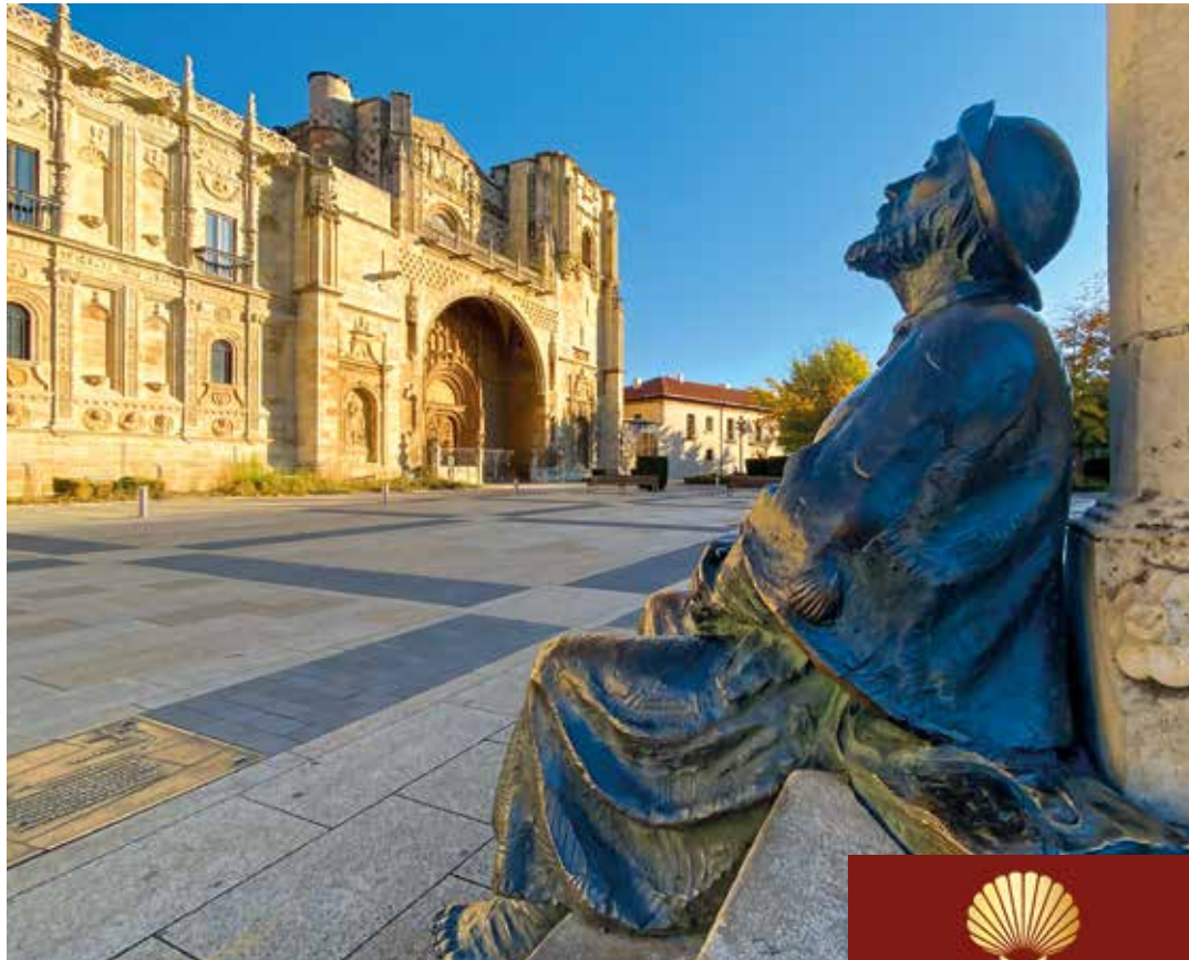
Pilgerdenkmal vor dem Parador in León