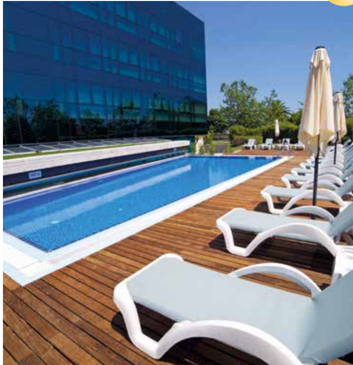
Erholen und entspannen am Pool (saisonal)