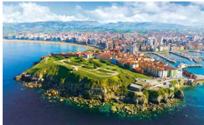
Cerro de Santa Catalina