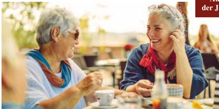
Sie sind eingeladen: Kaffeepause mit Gebäck & Fruchtspießen

Oviedo – Hauptstadt des Fürstentums Asturien