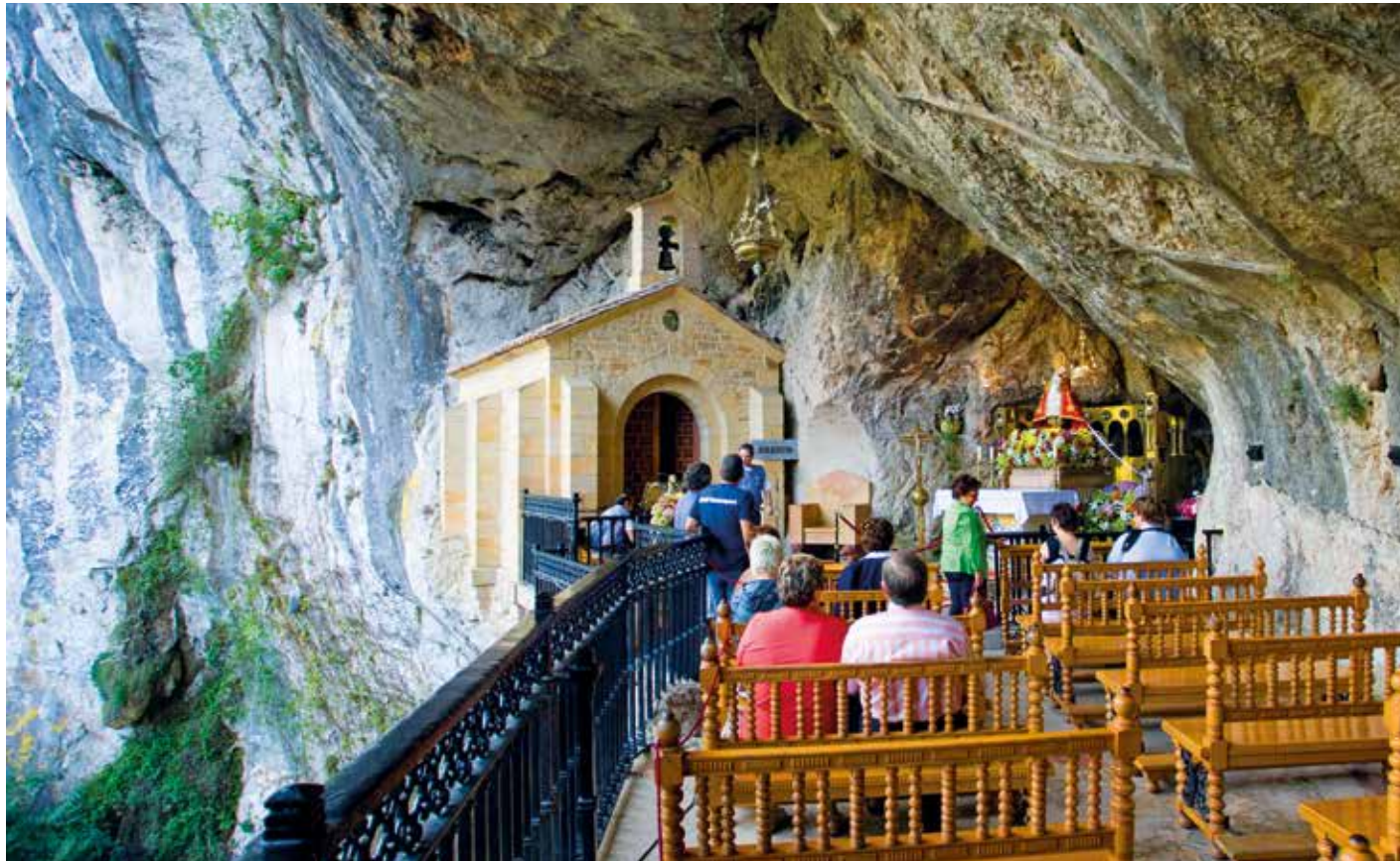
100 Stufen führen hinauf zur Mariengrotte von Covadonga – Kultstätte und Pilgerort für ganz Spanien