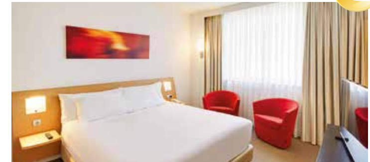
Unsere Zimmer sind stilvoll eingerichtet