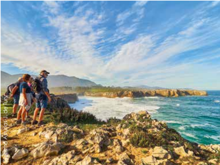
Eindrucksvolle Küstenlandschaft Asturiens

Valladolid ist für seine Tapas-Kultur bekannt. Wir genießen ein typisches 3-Gänge-Abendessen mit vielfältigen spanischen Spezialitäten.