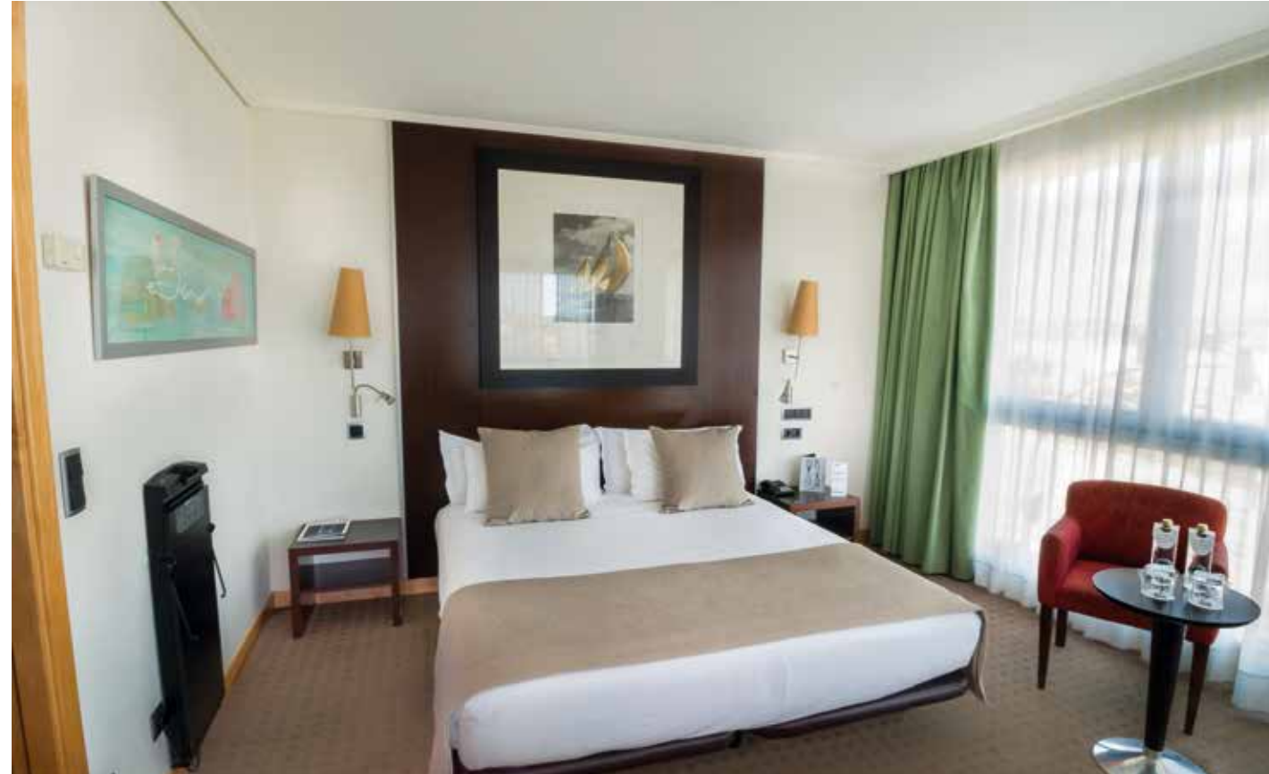
Unsere Zimmer sind gemütlich und modern eingerichtet