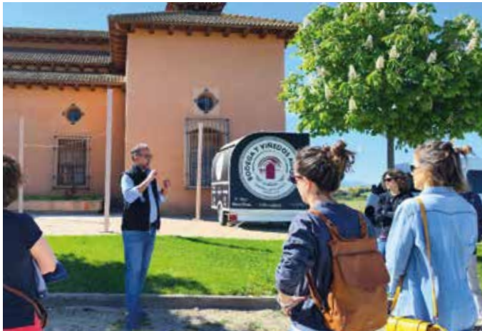
Der Winzer zeigt uns seine Bodega