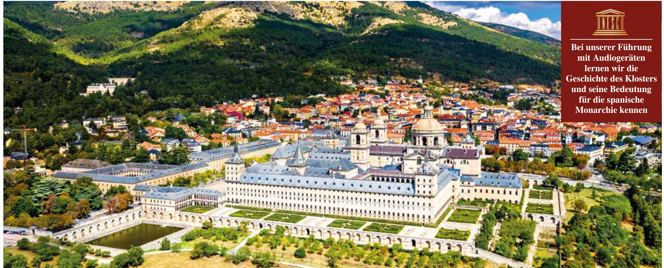
Das Kloster San Lorenzo de El Escorial liegt inmitten der Gebirgskette Sierra de Guadarrama, am Hang des Monte Abantos

Bei unserer Führung mit Audiogeräten lernen wir die Geschichte des Klosters und seine Bedeutung für die spanische Monarchie kennen