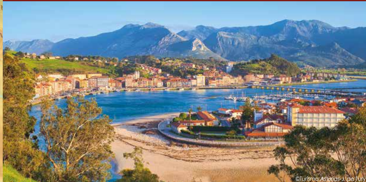
Malerischer Küstenort Ribadesella in Asturien

24/7 erreichbar: Unsere deutschsprachige Reiseleitung begleitet Sie!