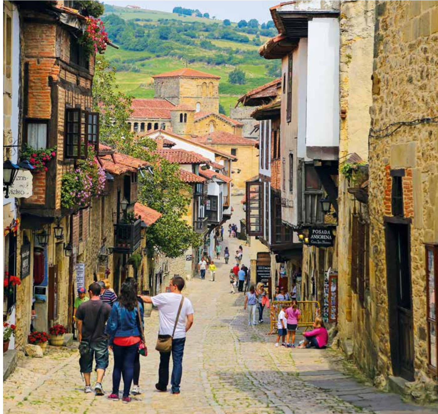
Santillana del Mar ist für die gut erhaltene Mittelalter-Architektur berühmt