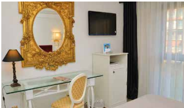
Gemütliche Zimmer im zentral gelegenen Hotel

... Weiterfahrt nach Salamanca, geführter Stadtrundgang und Freizeit, Check-in