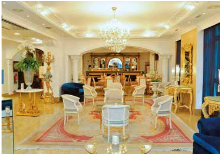
Spanisch einladend: die Hotelloobby