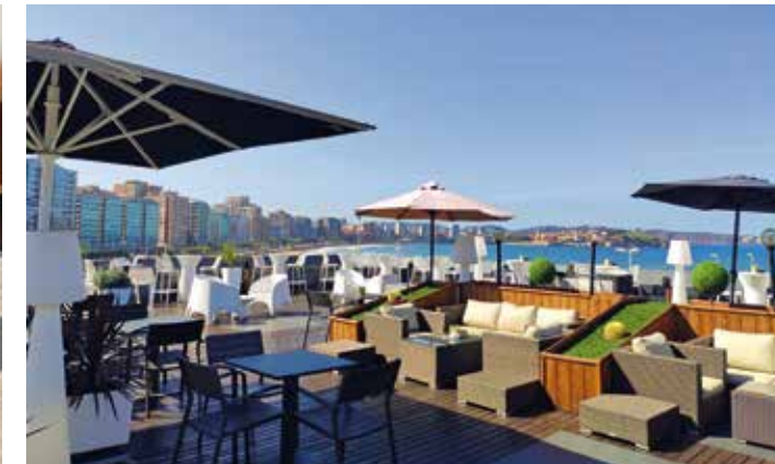
Die Dachterrasse bietet eine wundervolle Aussicht