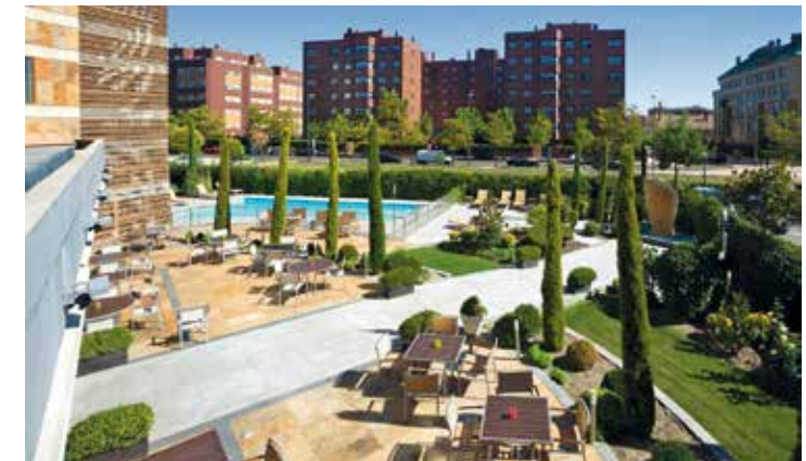
Erholung und Entspannung am Pool (saisonal)