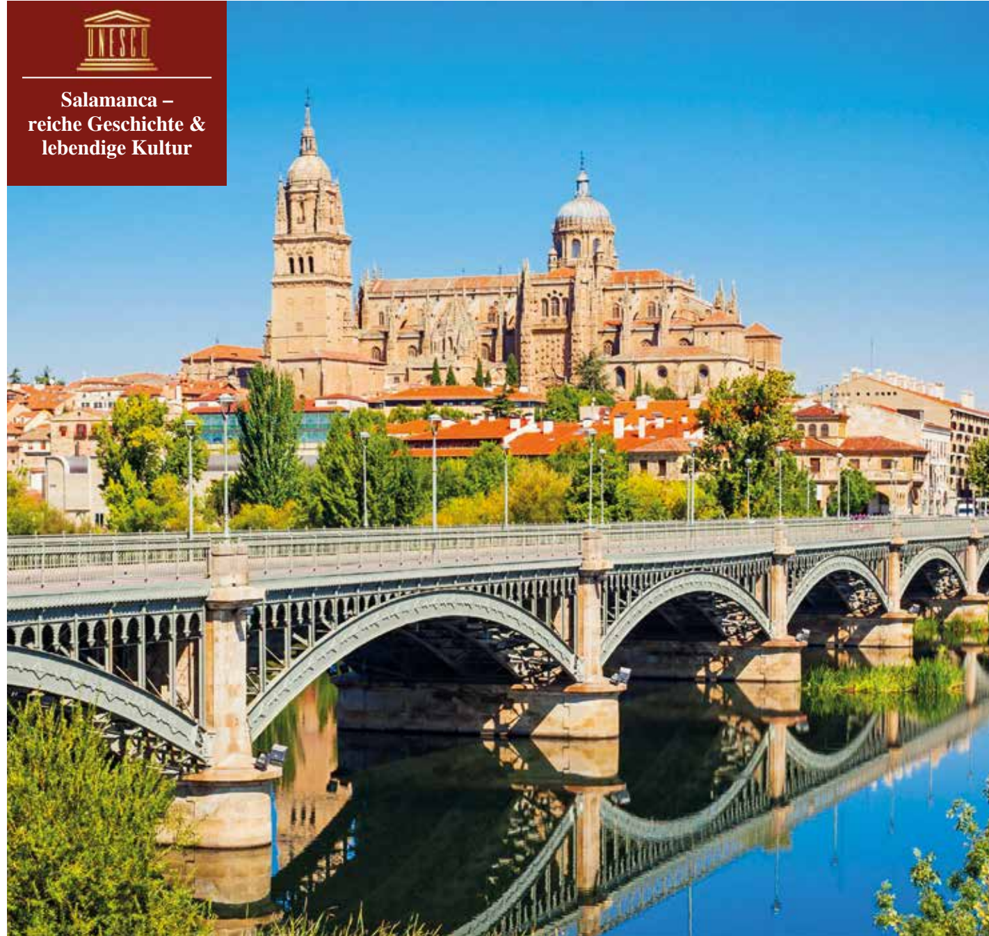
Die Enrique-Estevan-Brücke und die Kathedrale Nueva prägen die Stadtansicht von Salamanca

Salamanca – reiche Geschichte & lebendige Kultur