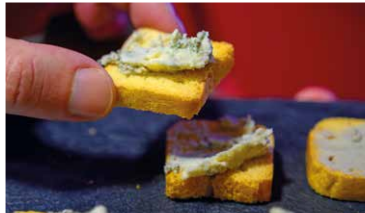
Queso de Cabrales – unsere kulinarische Empfehlung