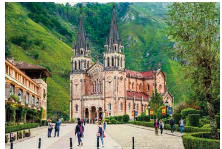
Covadonga – Marien-Wallfahrtsort in Asturien