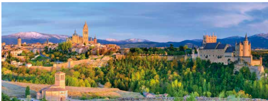
Die Burg Alcázar – ein architektonisches Meisterwerk voller Geschichte und Kultur