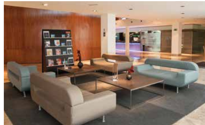
Die großzügige Lobby lädt zum Verweilen ein