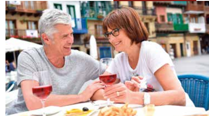
Genießen Sie Ihren freien Abend in Madrid

des Paseo de la Castellana mit der Plaza de Colón. Dieser Platz im Zentrum ist dem Entdecker Amerikas, Christoph Kolumbus, gewidmet. Während der Panoramafahrt sehen wir u. a. die Plätze Cibeles und España. Am Retiro-Park steigen wir für einen Fotostopp aus. Auf unserem geführten Stadtrundgang sehen wir u. a. den Templo de Debod, den Palacio Real, die Plaza Mayor, die Gran Vía und die Kirche San Antonio de los Alemanes.