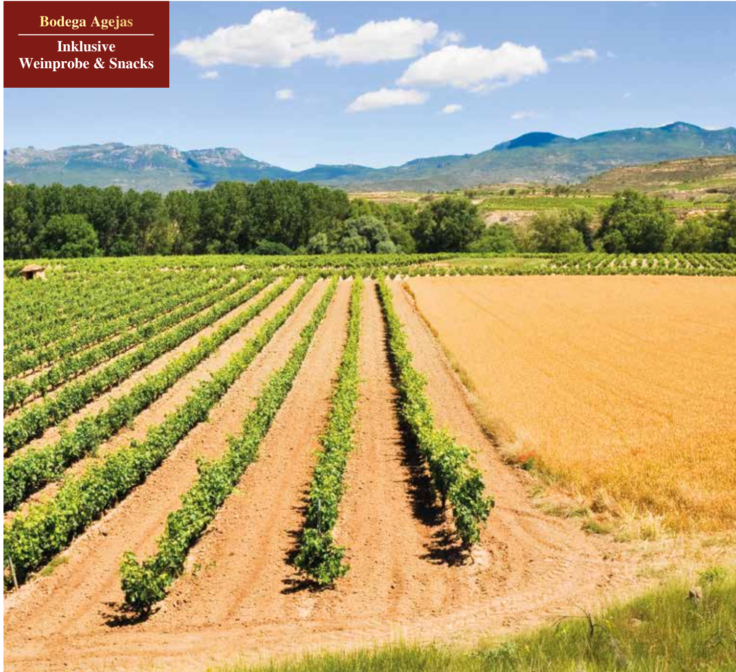
Durch landwirtschaftlich geprägte Landschaften fahren wir Richtung Segovia