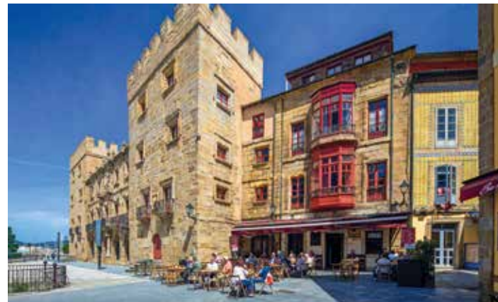
Palacio de Revillagigedo in der Altstadt