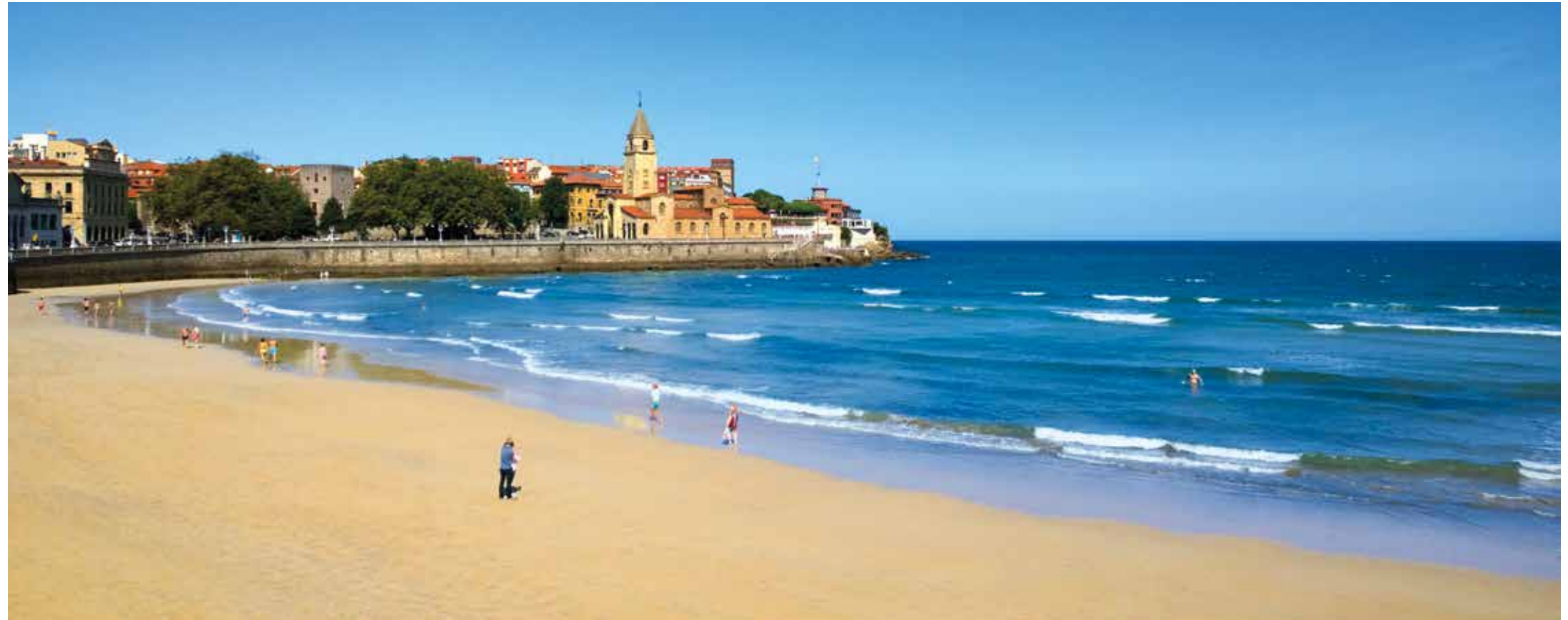
In einem weiten Bogen erstreckt sich über 1.500 Meter der schöne, feinsandige Stadtstrand Playa de San Lorenzo