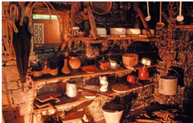
Im Museum wird eine historische Küche gezeigt

Im Museum erfahren wir mehr über den aufwendigen Herstellungsprozess des berühmten Blauschimmelkäses Cabrales. Eine Mischung aus Ziegen-, Kuh- und Schafsmilch wird mit viel Handarbeit und langer Reife in einer Kalksteinhöhle zu einem der besten Blauschimmelkäse mit cremig-kraftigem Geschmack. Mit Kostproben.