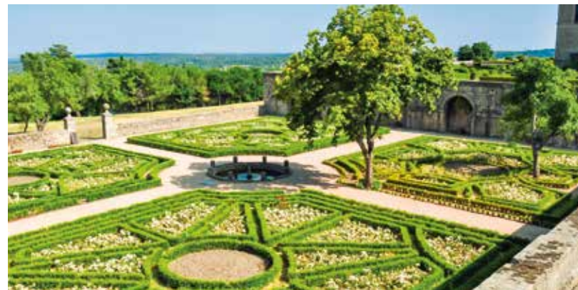
Der spanische König Philipp II. war ein großer Gartenfreund