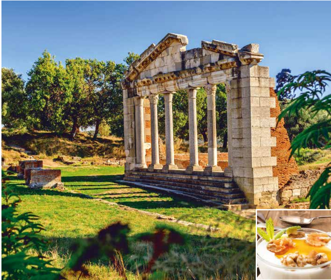
Beliebtes Fotomotiv: das Monument des Agonotheten