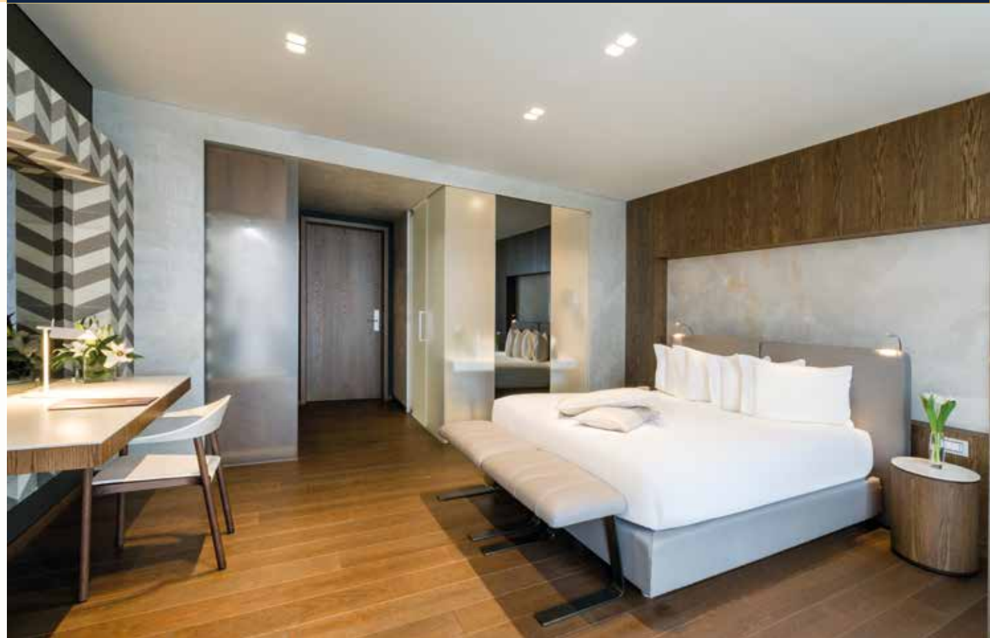
Große Wohlfühl-Zimmer, modern ausgestattet