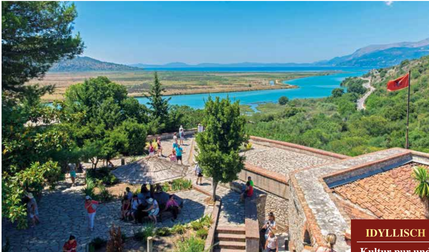
Rundblick von der venezianischen Burg über den Butrintsee und den Vivar-Kanal