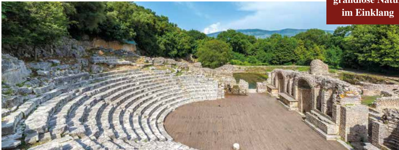
Das halbkreisförmige Theater zählt zu den am besten erhaltenen Bauwerken von Butrint