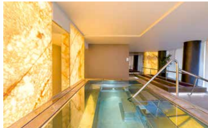
Die Kneipp-Einrichtung im Wellnessbereich