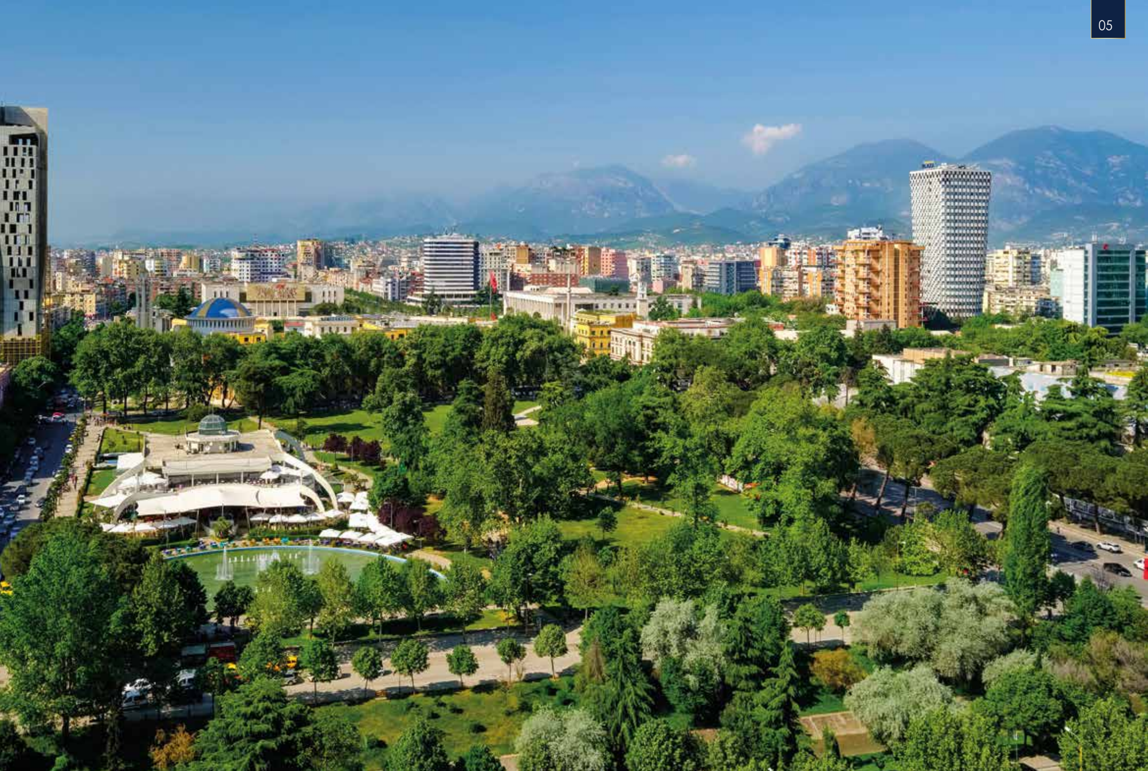
Im Rinia-Park in Tirana herrscht eine lockere, fröhliche Atmosphäre – hier treffen wir auf Einheimische und Familien und folgen dem bunten Treiben