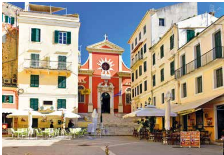
Malerische Altstadt von Korfu