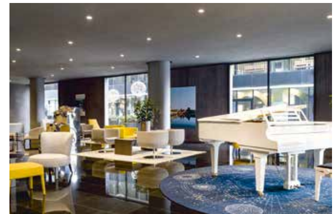
Die Pianobar bietet exzellente Unterhaltung

Tag 1 – Flug nach Albanien, Check-in für 3 Nächte