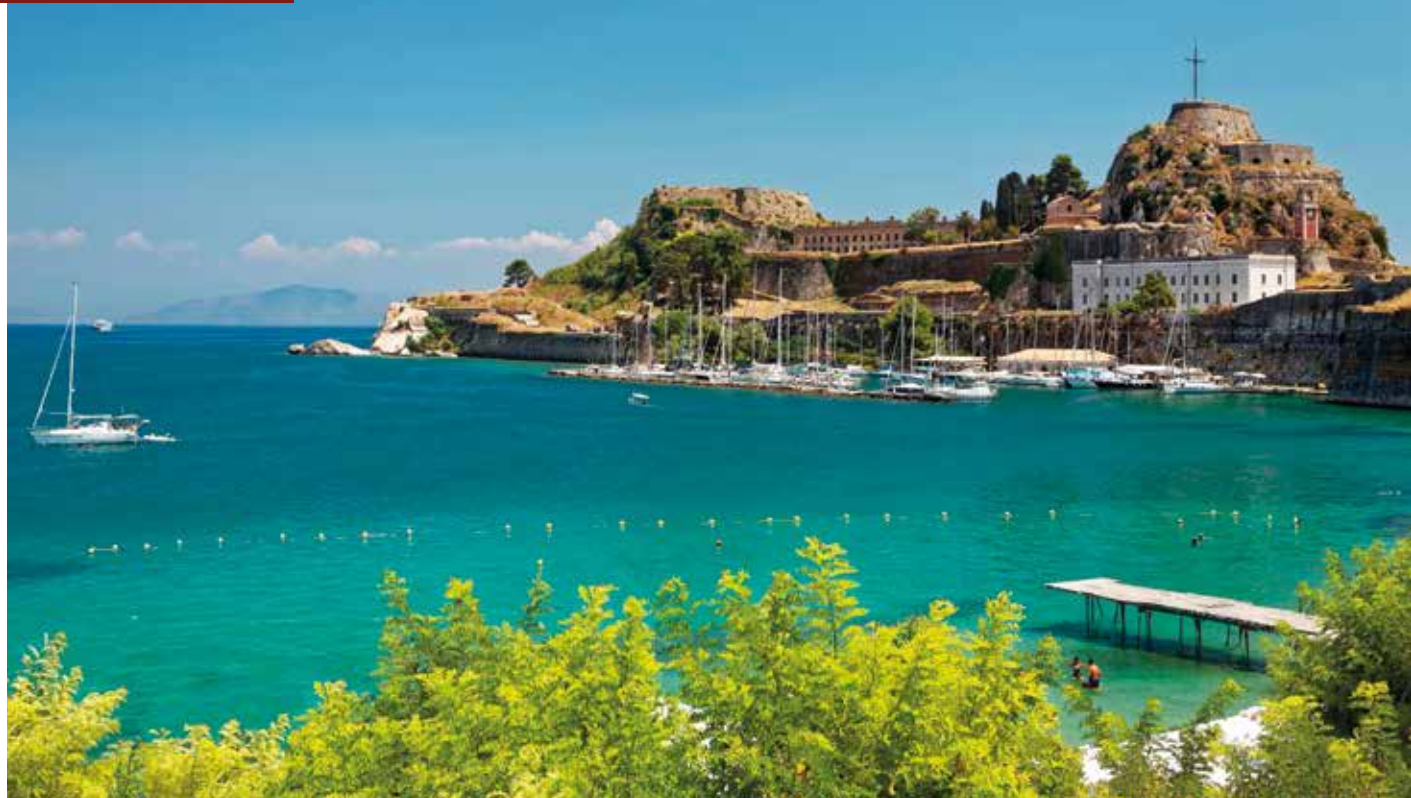
Die alte Festung ist eine beeindruckende Zitadelle auf einer felsigen Landzunge