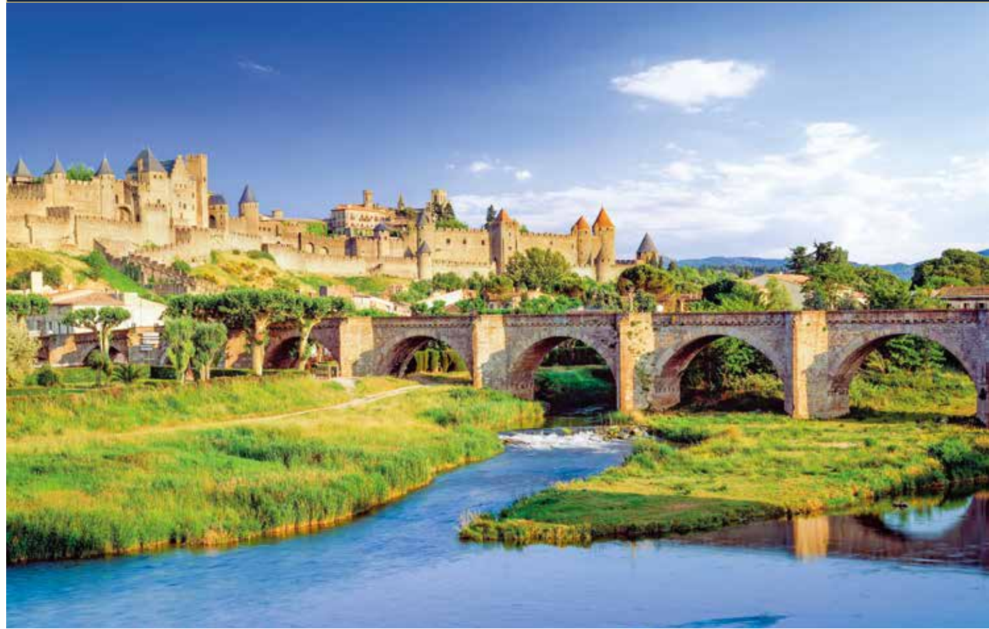
Der Besuch der UNESCO-Altstadt von Carcassonne gleicht einer Zeitreise