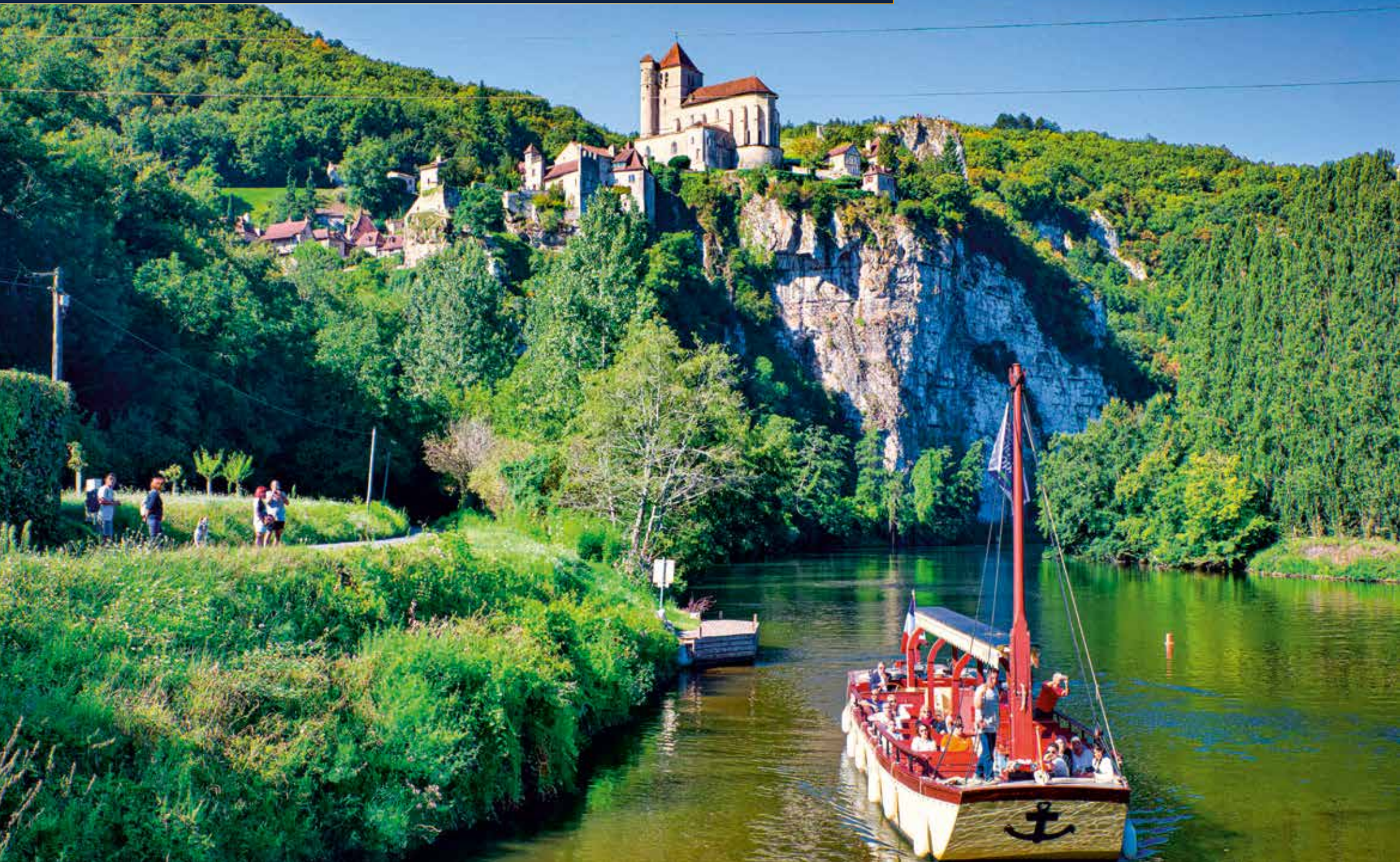
Romantische Bootsfahrt durch das Tal des Lot, vorbei an „sieben Wundern“, mittelalterlichen Stätten und imposanten Felsvorsprüngen