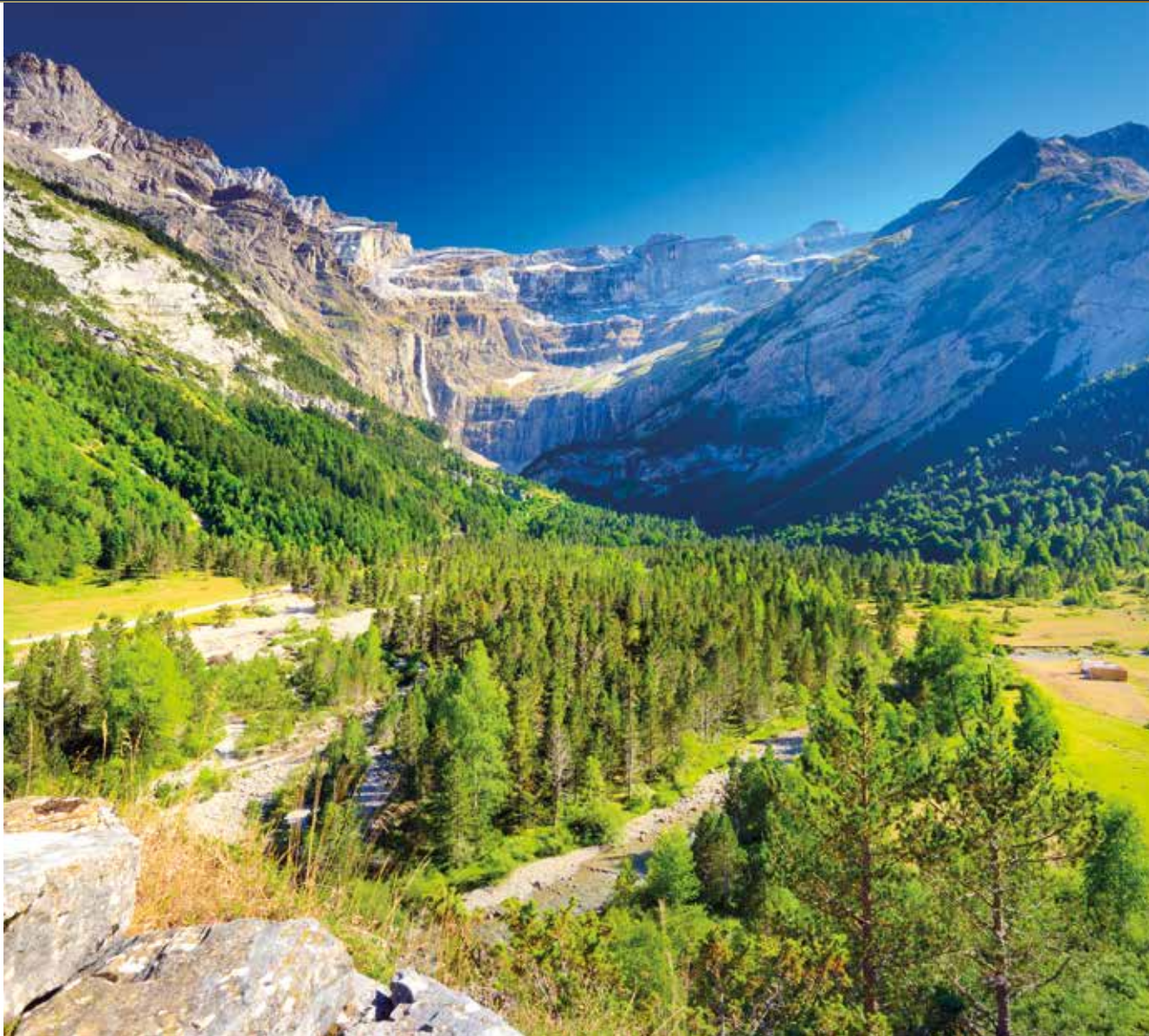
Eine Panoramafahrt ins landschaftliche Herz der Pyrenäen, nach Andorra la Vella