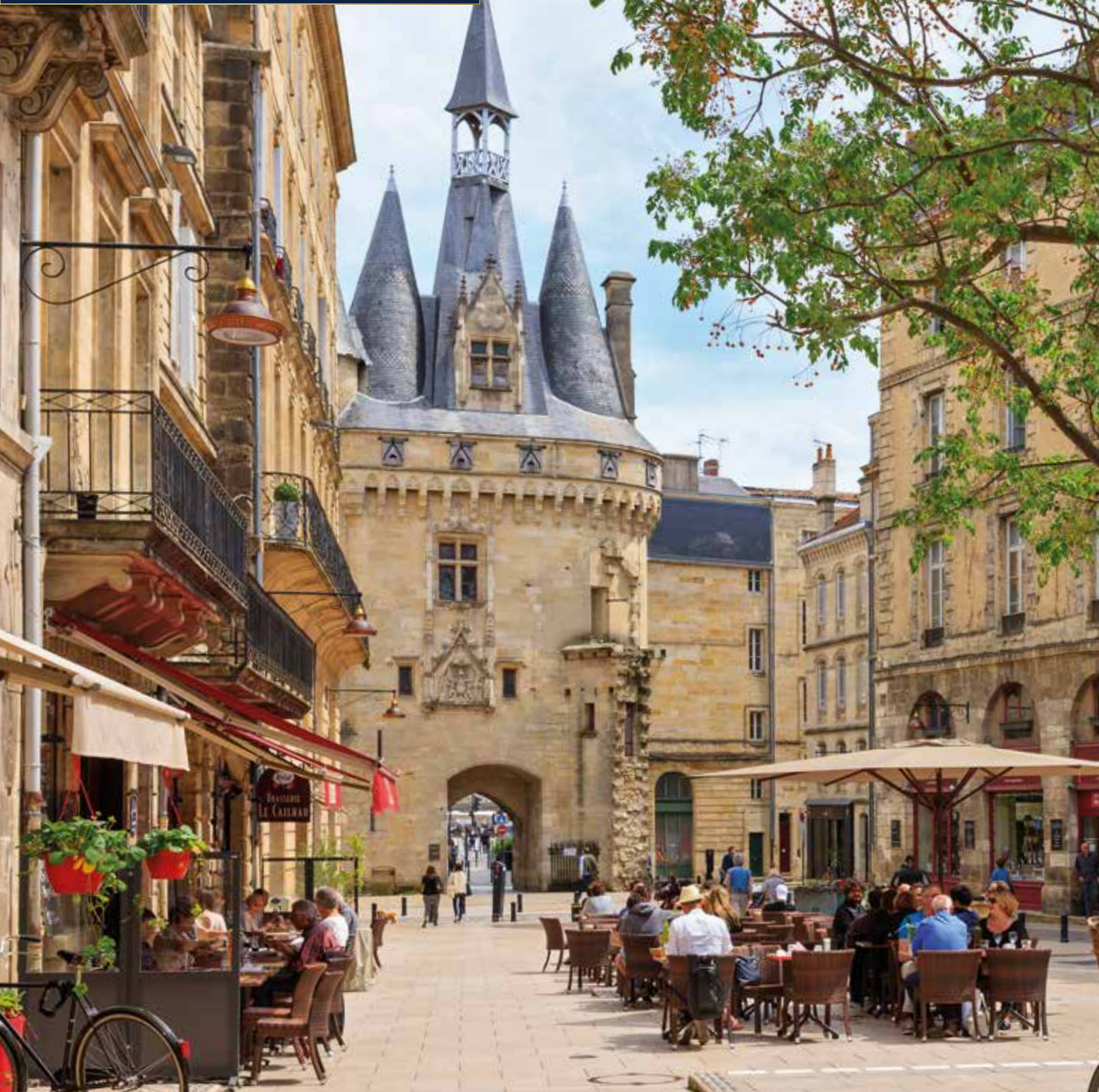
Das Stadttor Porte Cailhau wurde 1495 zu Ehren von König Karl VIII. von Frankreich errichtet