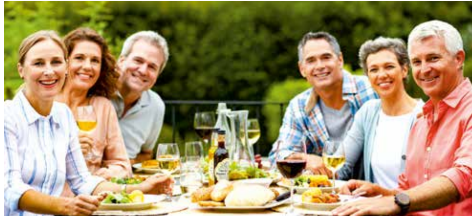
Brotzeit mit regionalen Köstlichkeiten