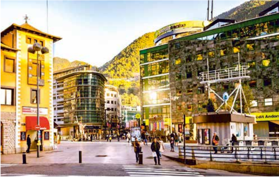
Innenstadt von Andorra la Vella