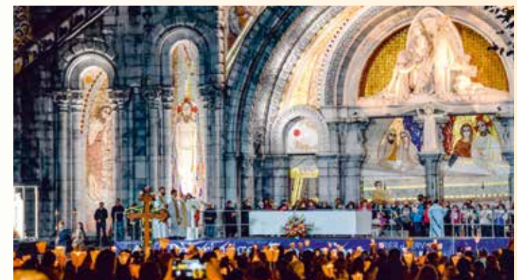
Eine Teilnahme an der Kerzenprozession ist möglich