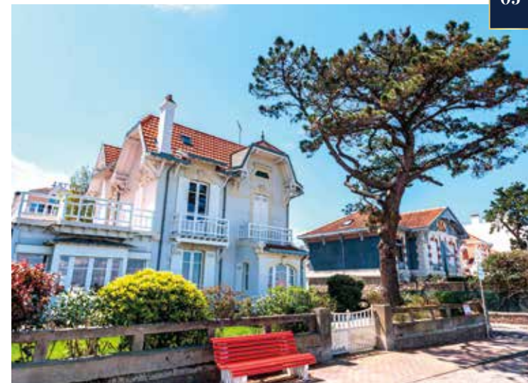
Alte Villen an der Promenade von Arcachon

Der Meeresnaturpark ist seit 1860 die Wiege der französischen Austernzucht und die größte Austernbrutstätte Europas. Hier haben Ebbe, Flut und Strömung außergewöhnliche Landschaften geformt. In manchen Jahren durchqueren mehr als 300.000 Vögel dieses Naturschutzgebiet. Eine Bootsfahrt zeigt uns die friedliche Schönheit der Bucht. Während eines Spaziergangs auf der Promenade von Arcachon entdecken wir einige Beispiele extravaganter Architektur.