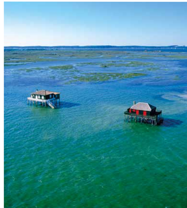
Ehemalige Fischerhütten auf Stelzen