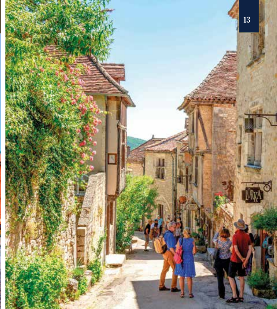
Freizeitipp: Am Place Nationale in Montauban können Sie Ihre Urlaubsabende genießen