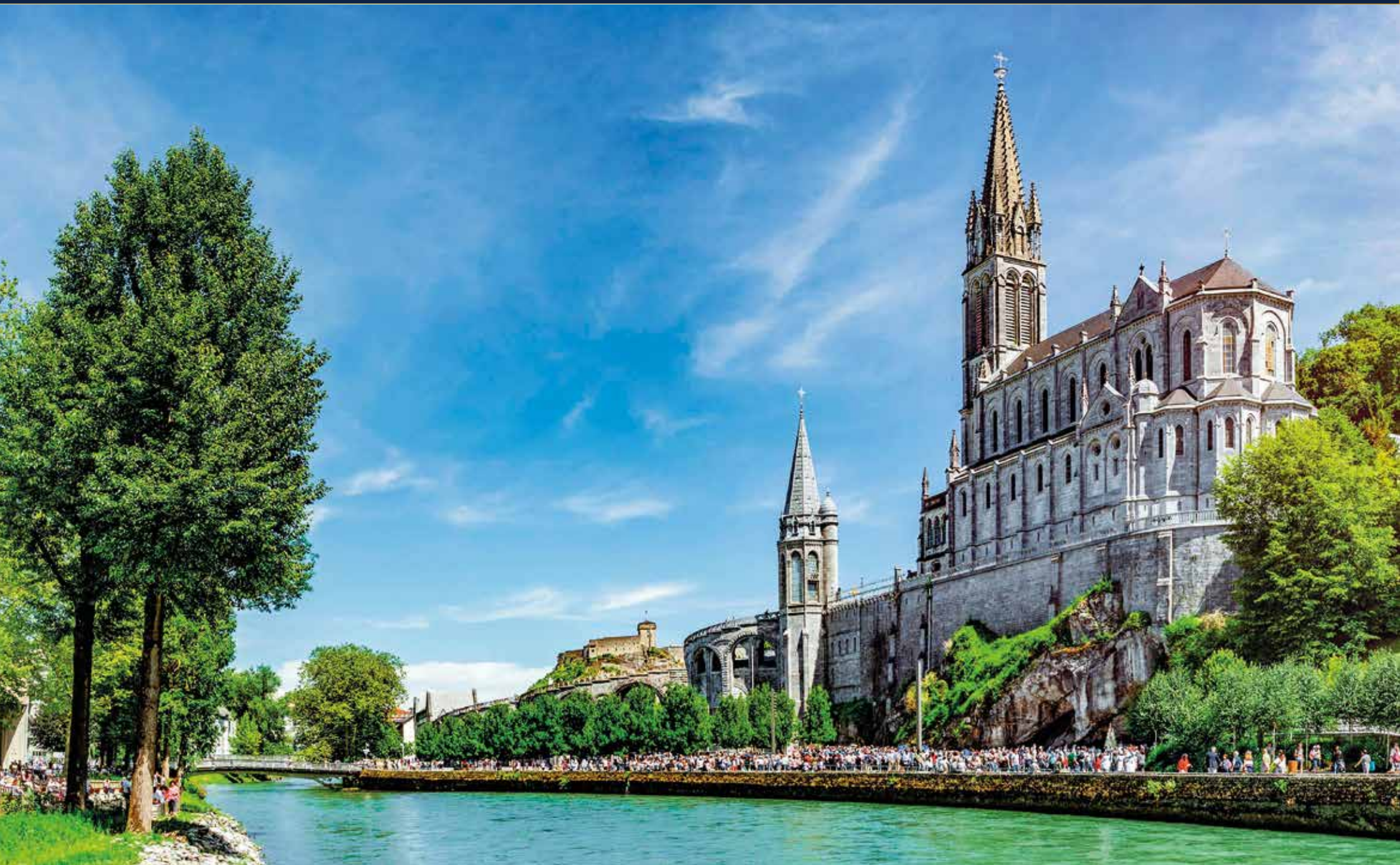
Die imposante Basilique Notre-Dame-du-Rosaire ist Teil des Heiligen Bezirks im Zentrum der Stadt Lourdes