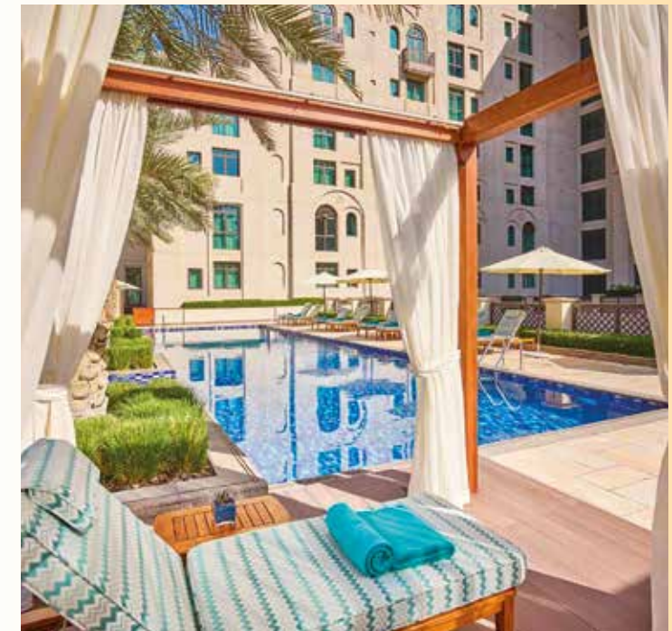
Gemütliche Liegen am Pool