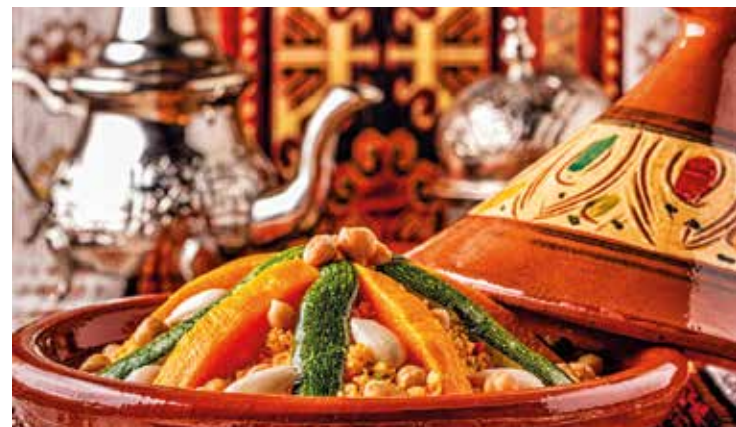
Die omanische Küche ist reich an Gewürzen und Aromen