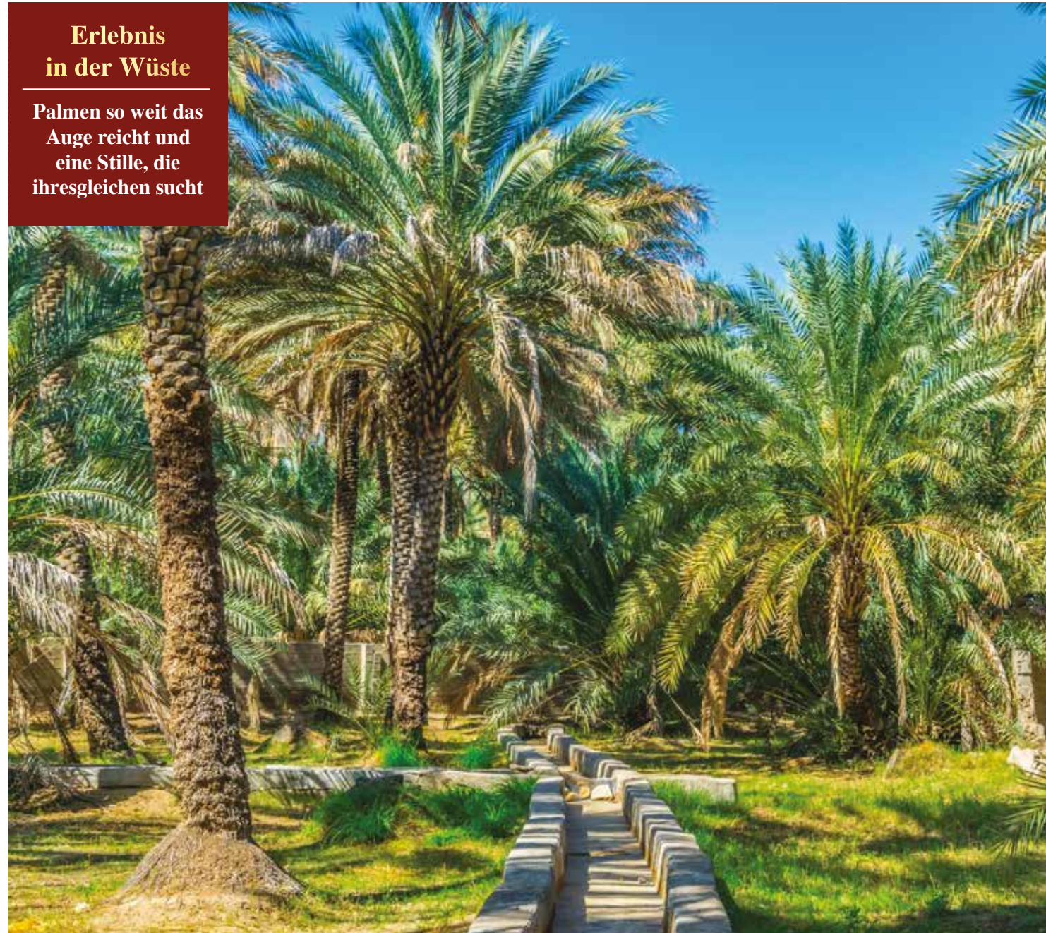
Al Ain ist für die lange Tradition der Dattelpflanzung in der Region bekannt

Palmen so weit das Auge reicht und eine Stille, die ihresgleichen sucht