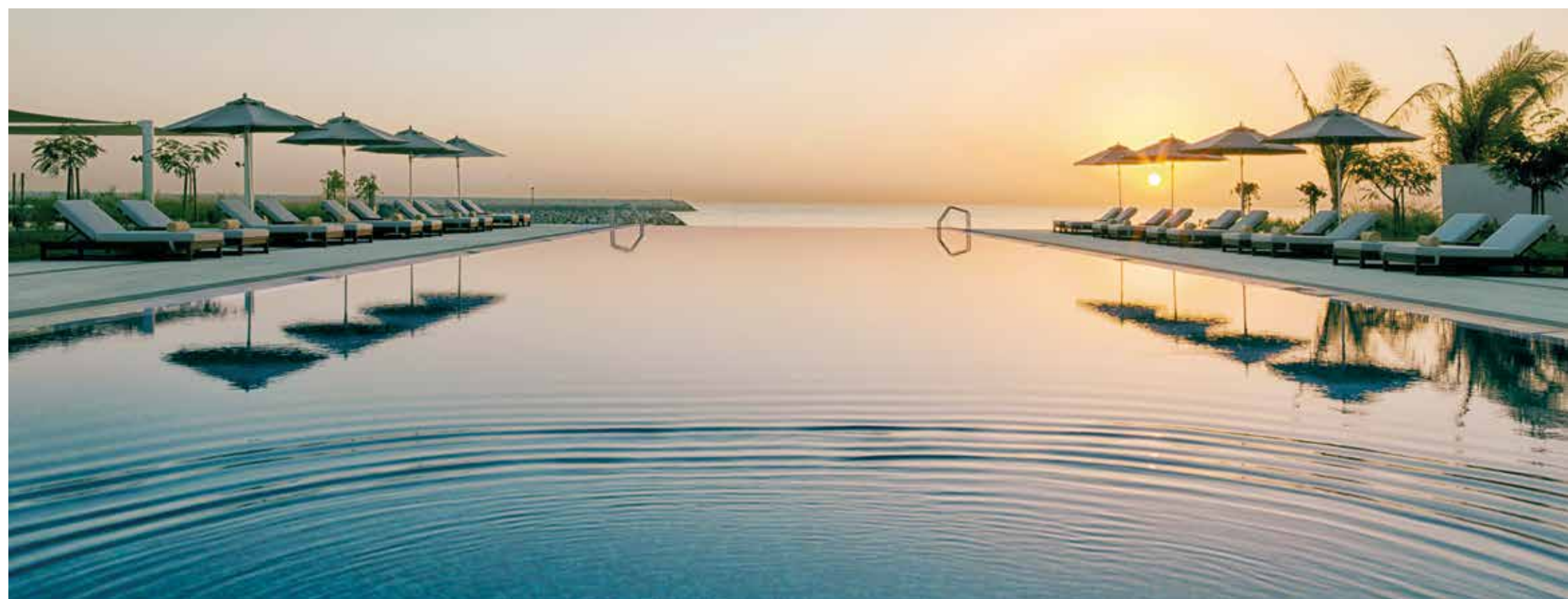
Wie wäre es anschließend mit einem Sundowner am luxuriösen Infinitypool?