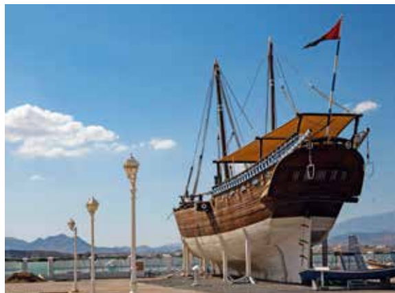
Hafenstadt Sur – traditionelles Handwerk

Die Hafenstadt an der Küste des Arabischen Meeres vereint reiche maritime Geschichte mit traditioneller Handwerkskunst. Sur hat eine lange Tradition als Zentrum des Schiffbaus im Oman. Hier werden auch heute noch traditionelle omanische Dhau, Holzschiffe mit Lateinersegeln, von Hand gebaut. Wir besichtigen eine Werft und können den Handwerkern bei der Arbeit zusehen.