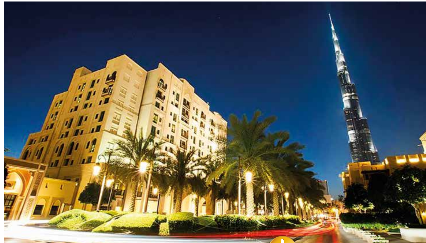
Top bewertet bei Booking.com mit „Hervorragend“, Stand: März 2024