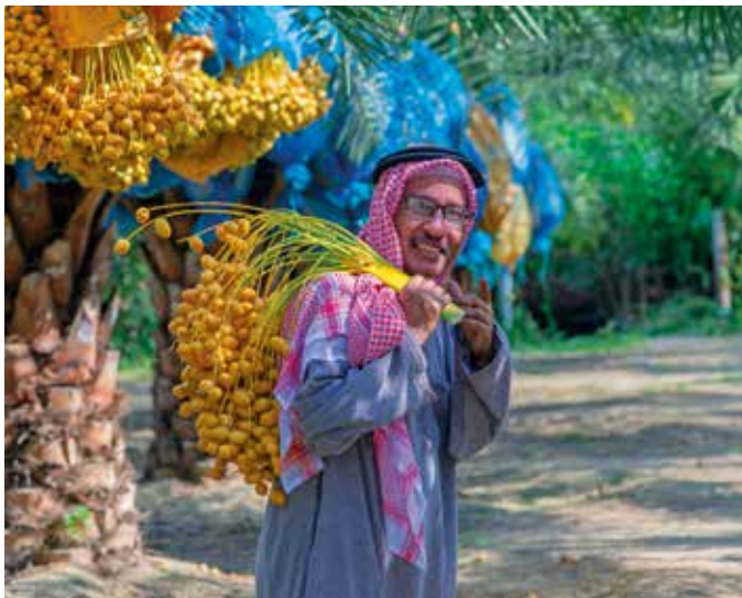
Frisch von der Palme sind die Datteln sehr lecker

Auf dem Weg ins Sultanat Oman machen wir einen Stopp für ein arabisches Mittagessen.