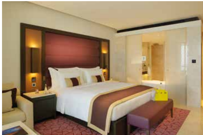
Doppelzimmerbeispiel unserer Kategorie