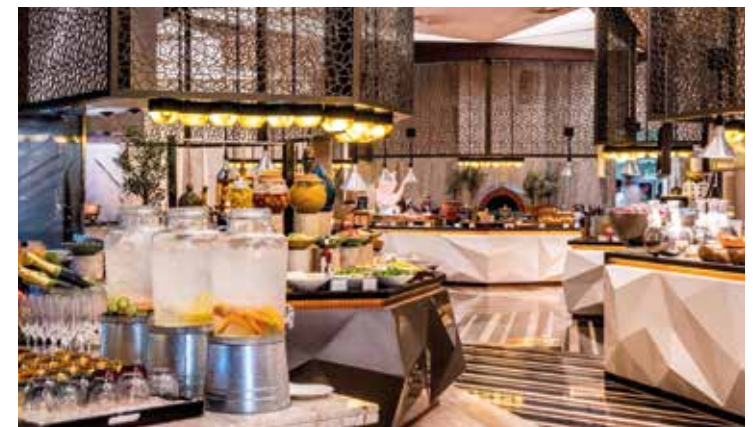
Das Abendessen genießen wir in unserem Hotel