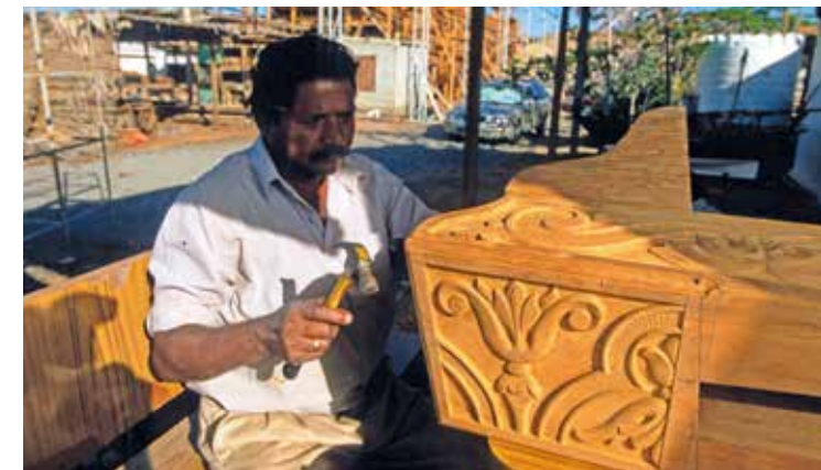
Wir schauen den Schiffsbauern über die Schulter