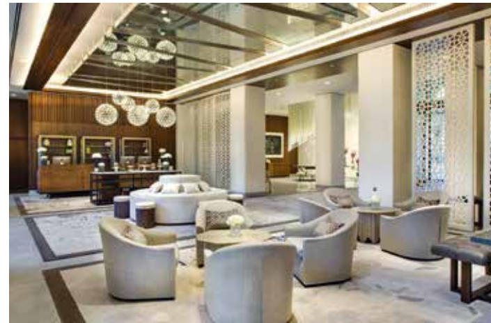
Das Hotel verbindet traditionelle arabische Architektur mit modernem Design, Zimmerbeispiel