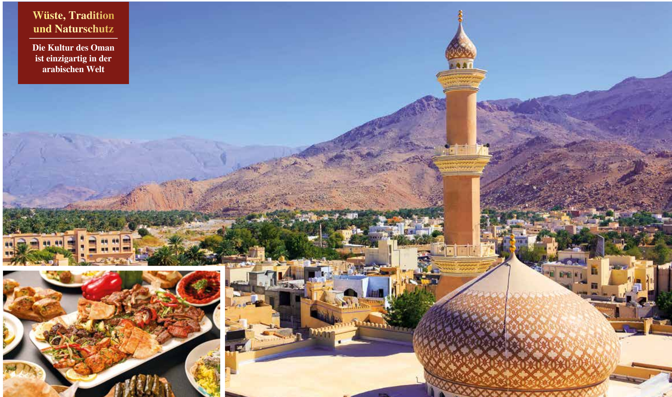
Die arabische Küche ist bunt und vielseitig

Die Kultur des Oman ist einzigartig in der arabischen Welt