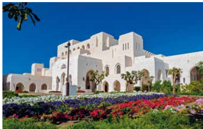
Fotostopp am königlichen Opernhaus in Maskat