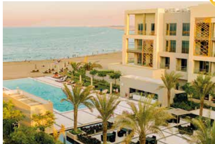
Unser Hotel liegt direkt am Meer und bietet ein luxuriöses Umfeld mit vielen Annehmlichkeiten