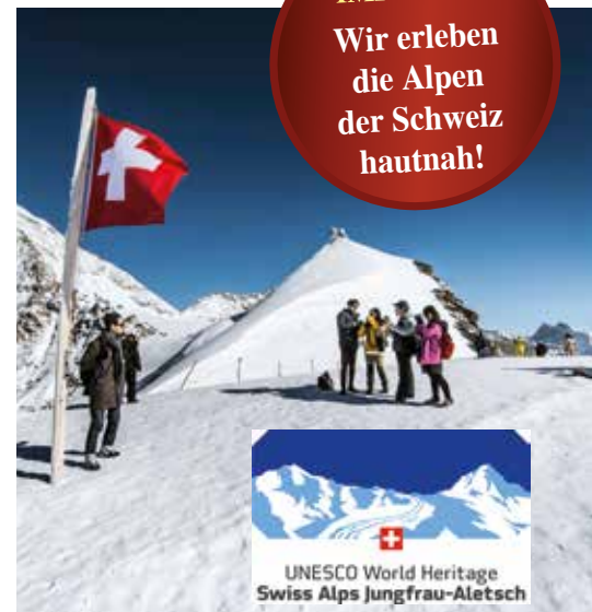
▲ Alpine Wunderwelt im Sommer