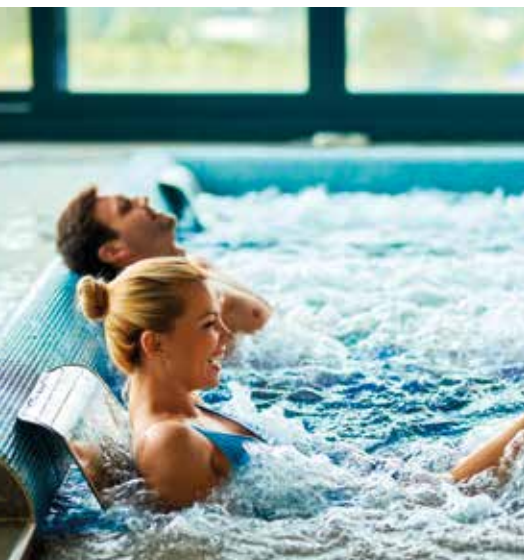
▲ Entspannte Auszeit

IMPOSANT Wir erleben die Alpen der Schweiz hautnah!