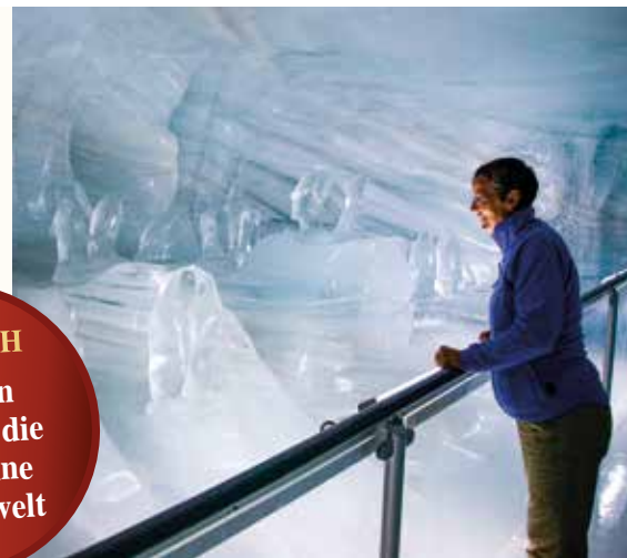
▼ Aussichtsterrasse und Eispalast ▲

MAGISCH Tauchen Sie ein in die hochalpine Wunderwelt