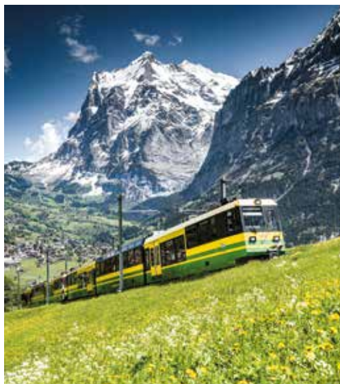
▲ Unvergessliche Bahnfahrt