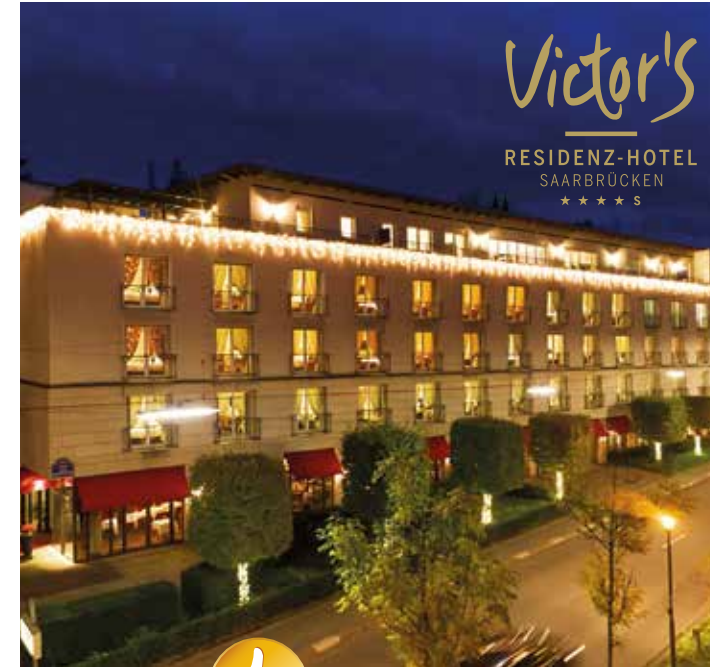
Beide Hotels sind top bewertet auf Booking.com mit „Sehr gut“ (Stand: Februar 2024)