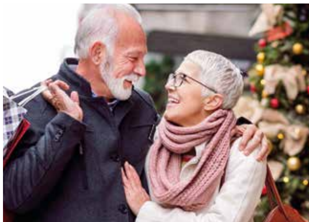
Genießen Sie die Zeit zu zweit

Auf dem Saarbrücker Christkindl-Markt ist der fliegende Weihnachtsmann die Hauptattraktion. Rund 80 außergewöhnlich und geschmackvoll gestaltete Büdchen auf dem St. Johanner Markt und auf der Bahnhofstraße versprühen festliche Weihnachtsstimmung . Highlights sind die urige Almhütte, der riesige Adventskranz, die Glockenstube mit integriertem Glockenspiel, das Lebkuchenhaus und die lebensgroßen Weihnachtsfiguren. Die Abende in Saarbrücken stehen Ihnen zur freien Verfügung . Nutzen Sie die Saarland Card , um kostenlos mit dem Linienbus in die festlich geschmückte Stadt zu gelangen.