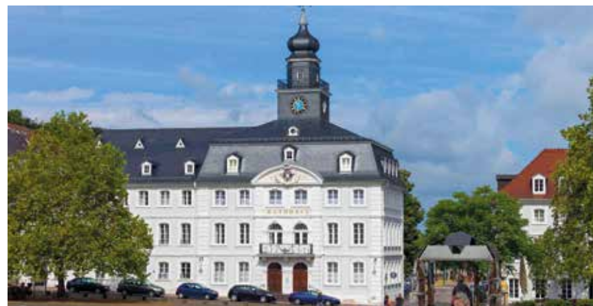
Altes Rathaus Saarbrücken