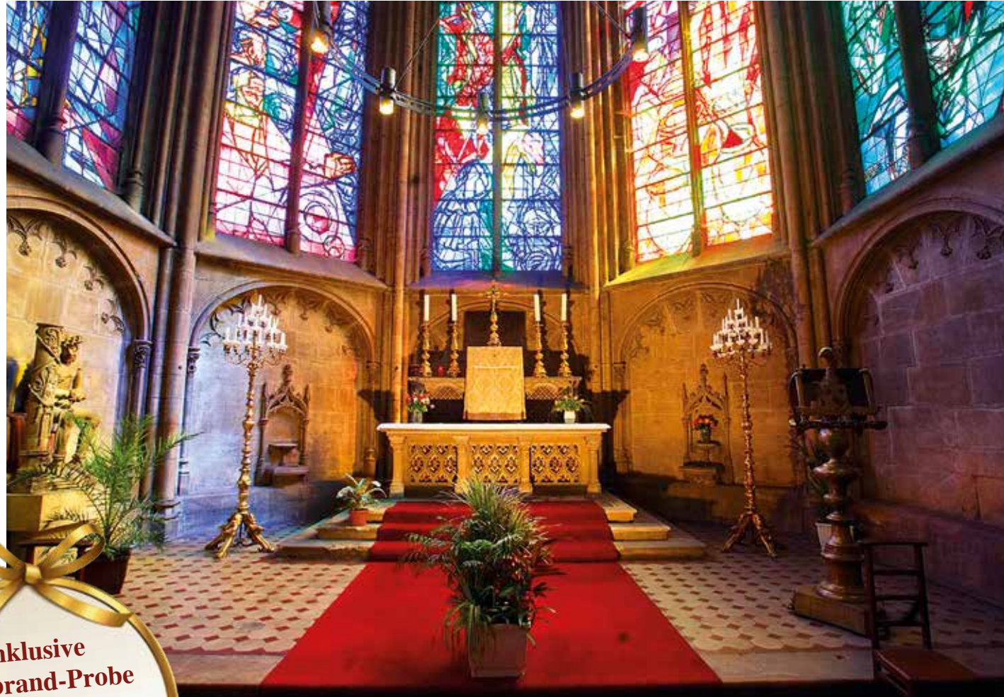
Die Kathedrale Saint-Étienne ist ein wahrhaftes Juwel der Architektur

Die edlen Schnäpse (Eau de vie) werden wir im Anschluss auch verkosten und genießen dazu eine frische Tartelette mit Apfel oder Mirabelle.