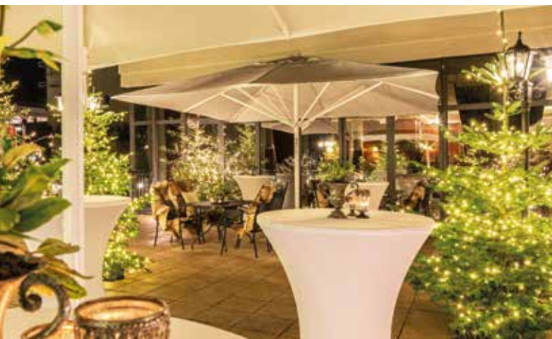
Empfang mit einem Glühwein oder Punsch und Gebäck

Klassisch-elegant, Telefon, Kabel-TV, Minibar, Schreibtisch, Bad mit Dusche oder Wanne, Föhn