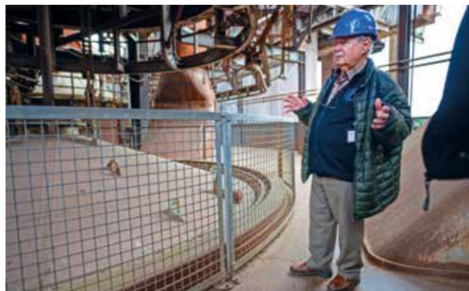
Unser Gästebegleiter erklärt auch den Hochofen