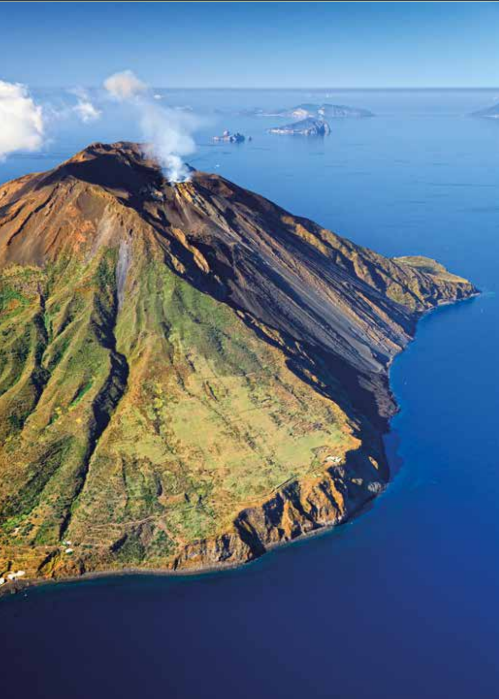
Der Stromboli ist einer der aktivsten Vulkane der Welt