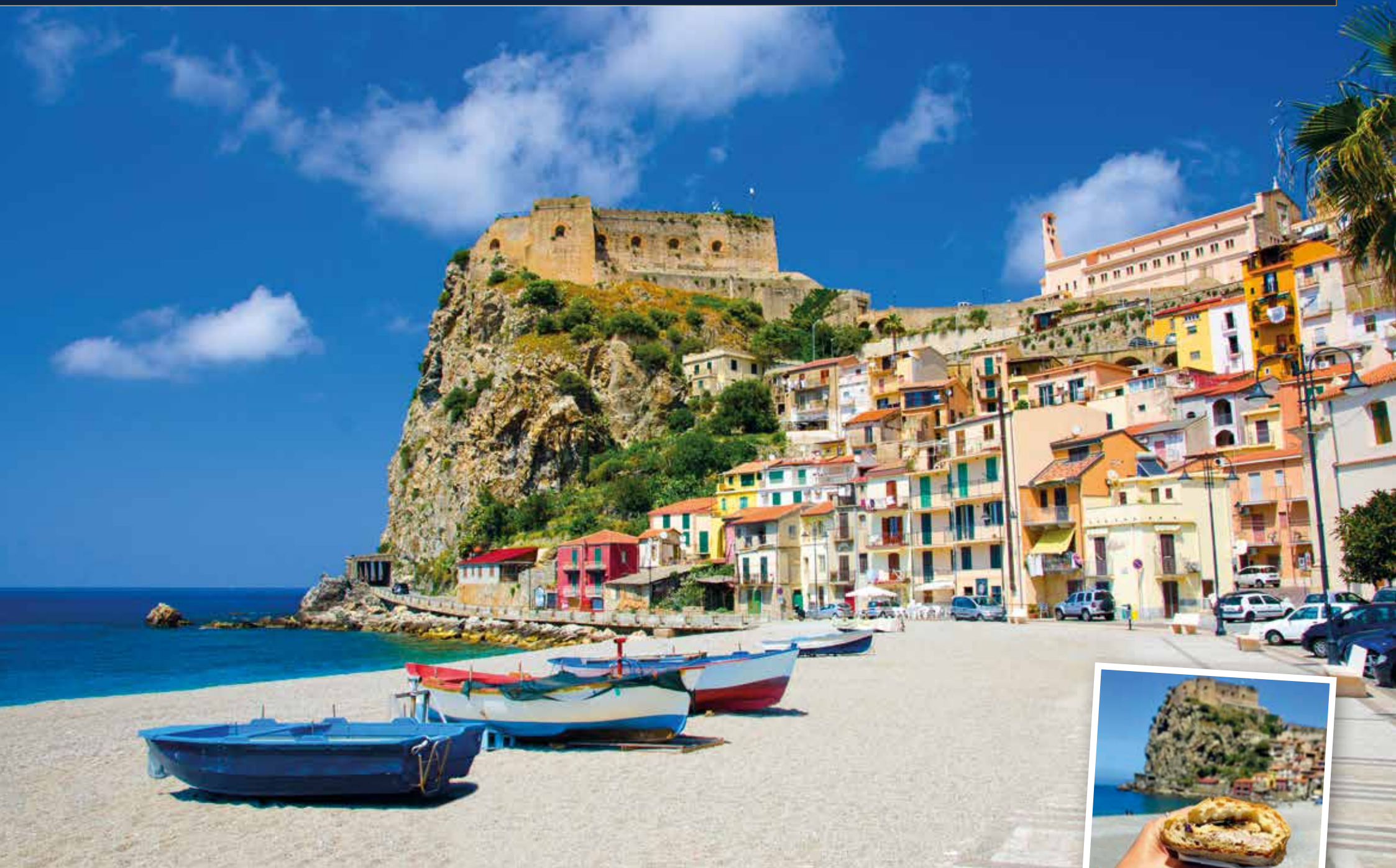
An der bunten Strandpromenade von Scilla genießen wir ein Schwertfisch-Panino, ein authentisch-regionales Streetfood