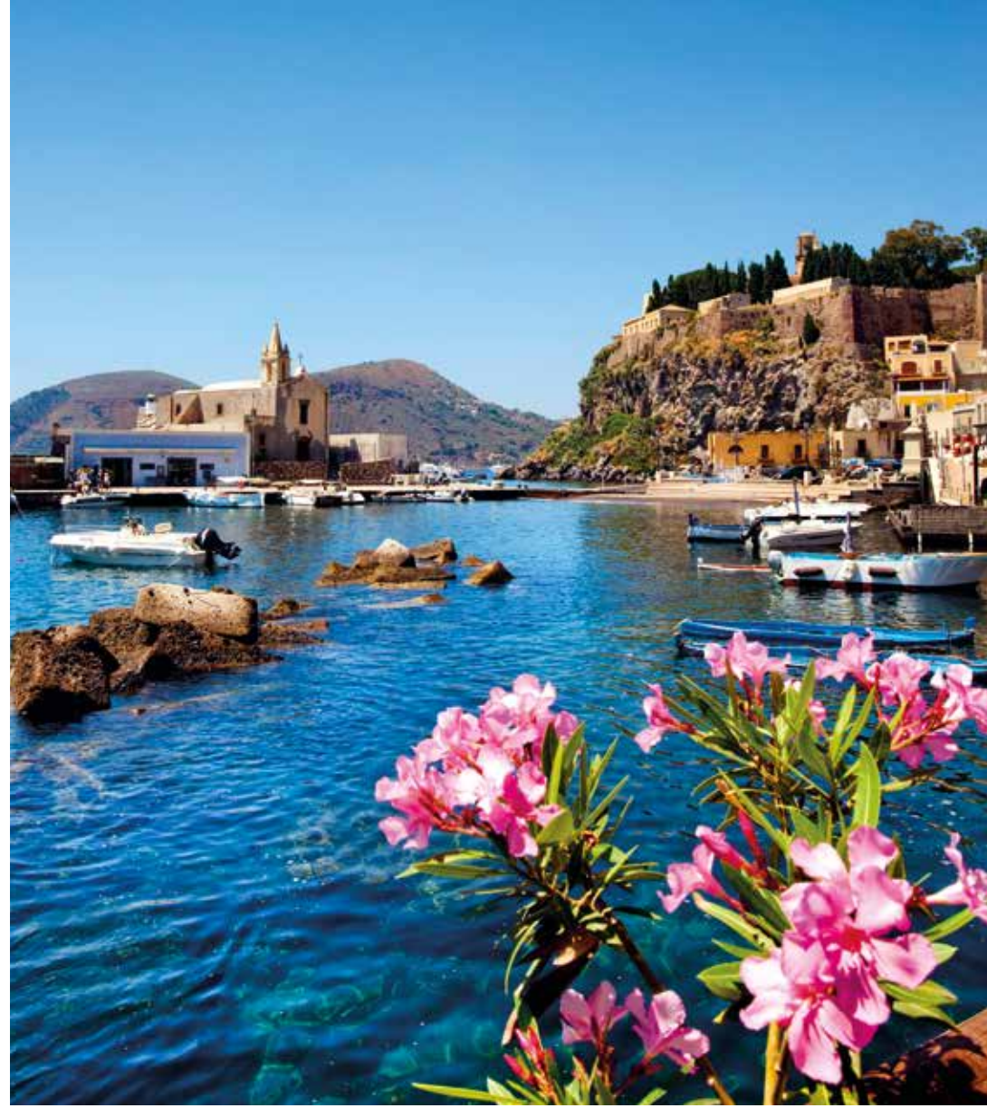
Lipari wird vom Burgfelsen mit der spanischen Festung dominiert