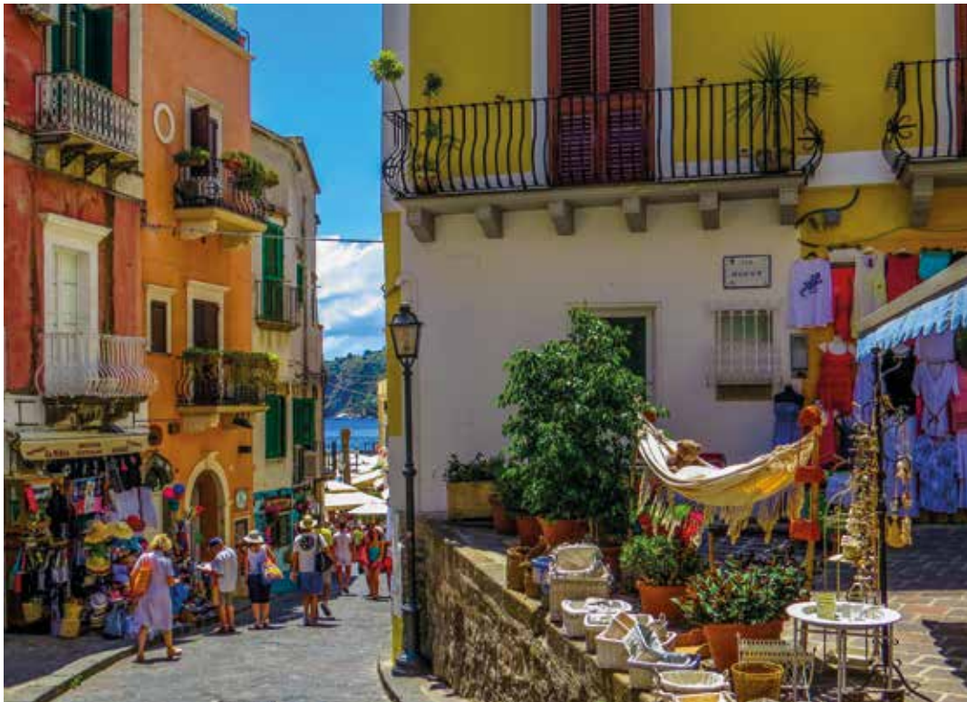
Bei einem Spaziergang durch das charmante Lipari lässt sich die entschleunigte Inselatmosphäre mit allen Sinnen aufnehmen

EINLADUNG zum 2-Gänge- Mittagsmenü mit Kreationen der Inselküche