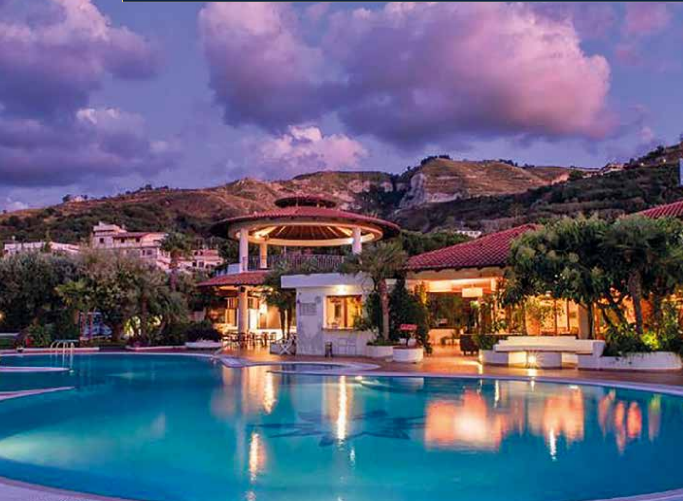
Ihr Hotelpool mit Blick über die mediterrane Landschaft und das Meer