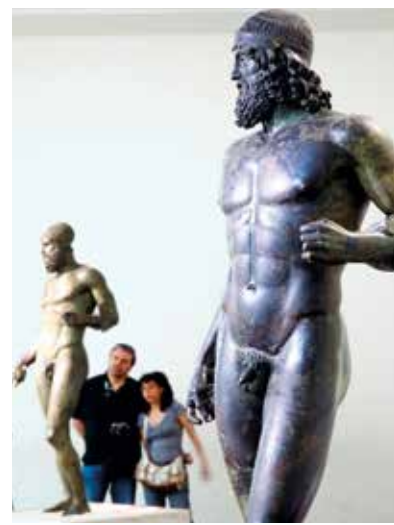
Die Ursprünge der Stadt Reggio Calabria liegen weit zurück: Sie wurde 734 v. Chr. von den Griechen gegründet. Berühmt ist die Stadt für die herrlichen Jugendstilvillen, die man beim Schlendern durch die Altstadt bestaunen kann. Das Museum beherbergt einige aus dem 5. Jahrhundert stammende Bronzestatuen, die man auf dem Meeresboden gefunden hat