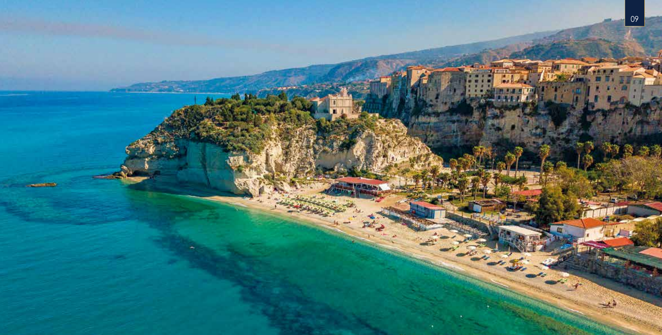
Unterhalb von Tropea erstreckt sich ein fast vier Kilometer langer Strand