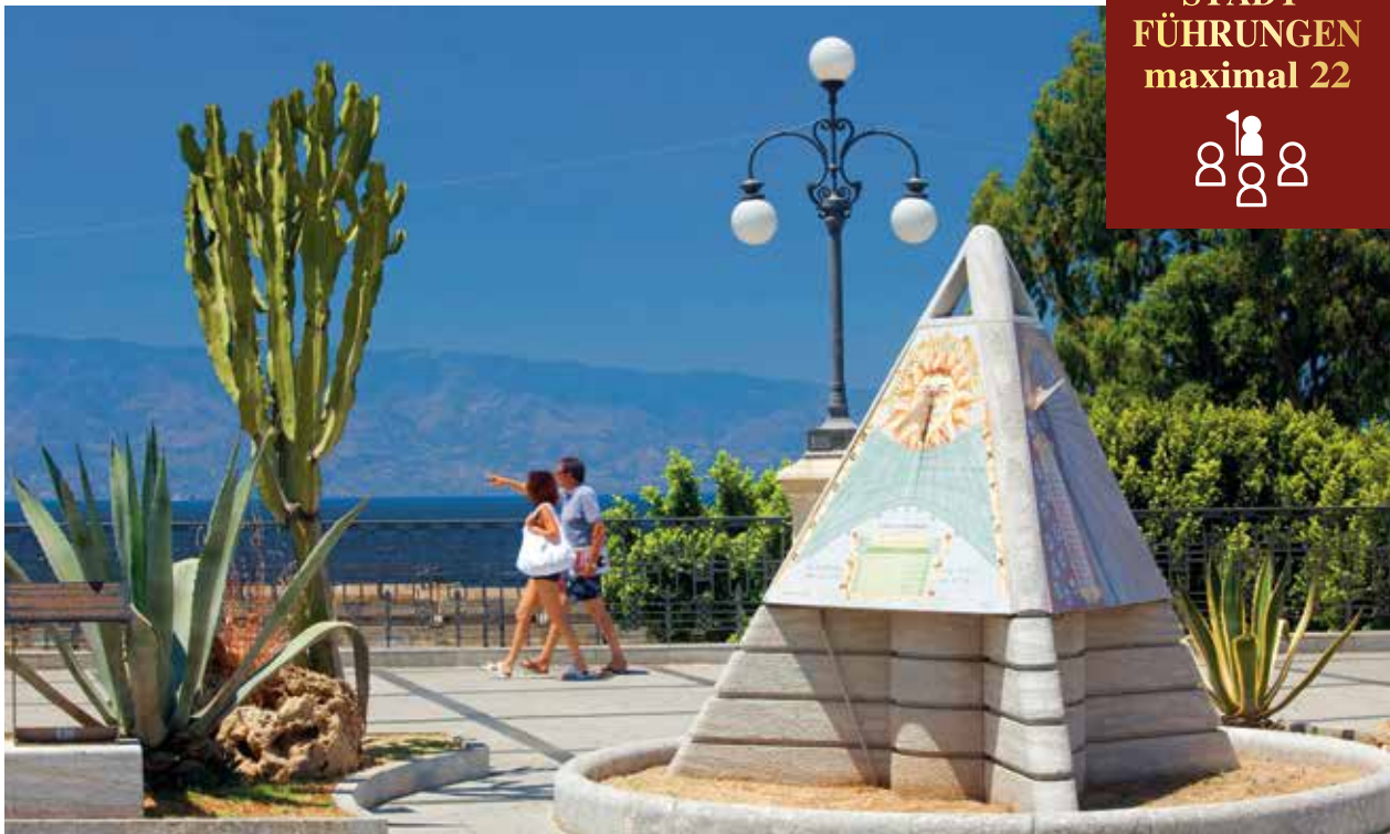
Die Uferpromenade Falcomatà ist als der schönste Kilometer Italiens bekannt