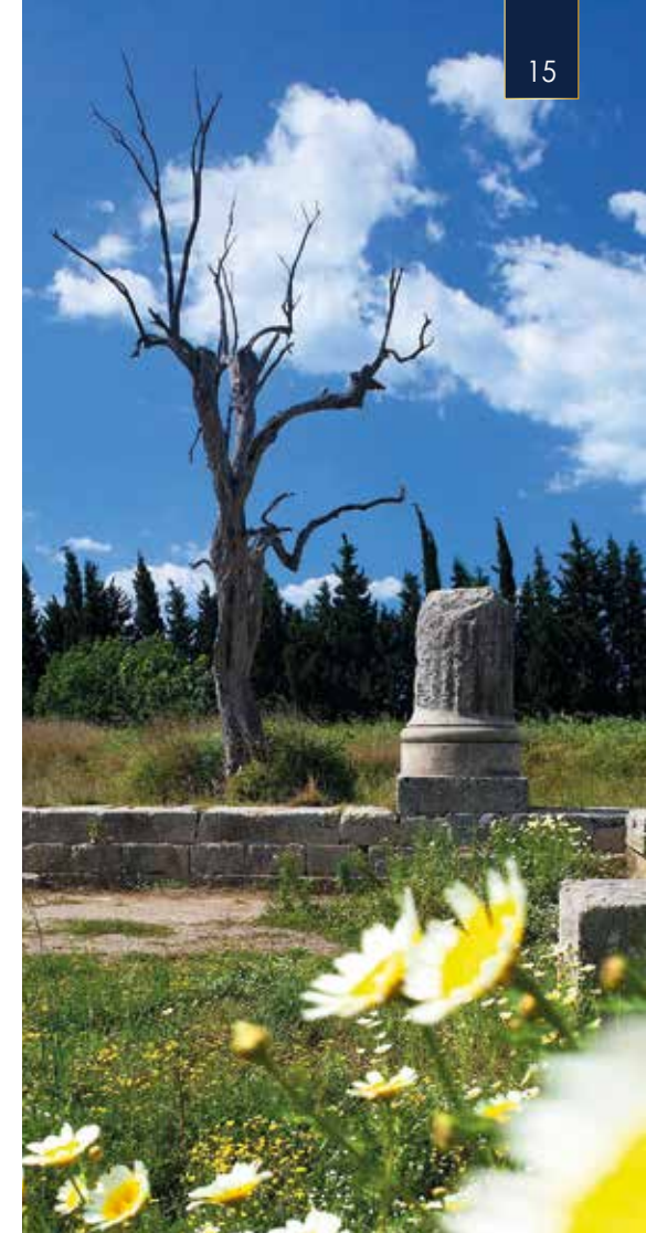
Geschichte unter freiem Himmel

Archäologischen Park von Locri. Die hiesigen Funde aus der Bronze- und Eisenzeit sowie der römischen und spätantiken Epoche ermöglichen uns, die über 4.000 Jahre alte erlebnisreiche Geschichte zu durchlaufen. Unter anderem sehen wir die Überreste des Marasà-Tempels. Dieser wurde 470 v. Chr. auf Befehl von Lero von Syrakus erbaut. Es war der größte dorische Tempel in Magna Grecia.