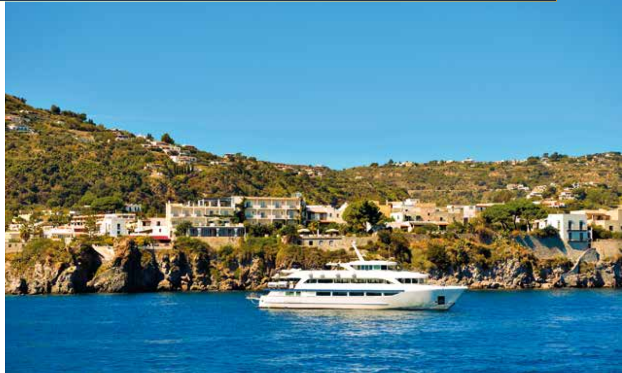
Inklusive Schifffahrt zu den Liparischen Inseln, Beispielfoto. Die „sieben Schönen“, wie sie von den Italienern liebevoll genannt werden, liegen vor der Küste Siziliens.