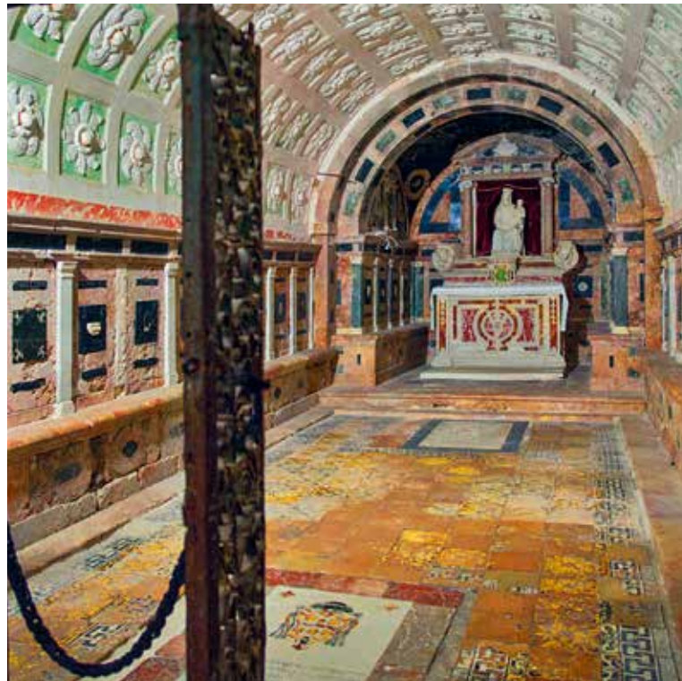
Blick in die beeindruckende Krypta

Unter den wichtigsten und größten normannischen Gebäuden Kalabriens ist die Kathedrale von Gerace, auch bekannt als die Basilika Santa Maria Assunta. Ein architektonisches Juwel in einem kleinen mittelalterlichen Dorf. Gerace wurde im 10. Jahrhundert von den Überlebenden des alten Locri Epizephyrii gegründet, die vor den Überfällen der Sarazenen flohen. Mehr dazu erfahren wir im