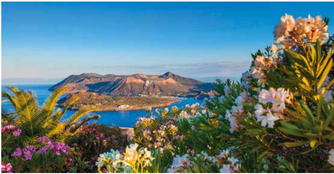
Panoramablick von Lipari aus auf die Insel Vulcano