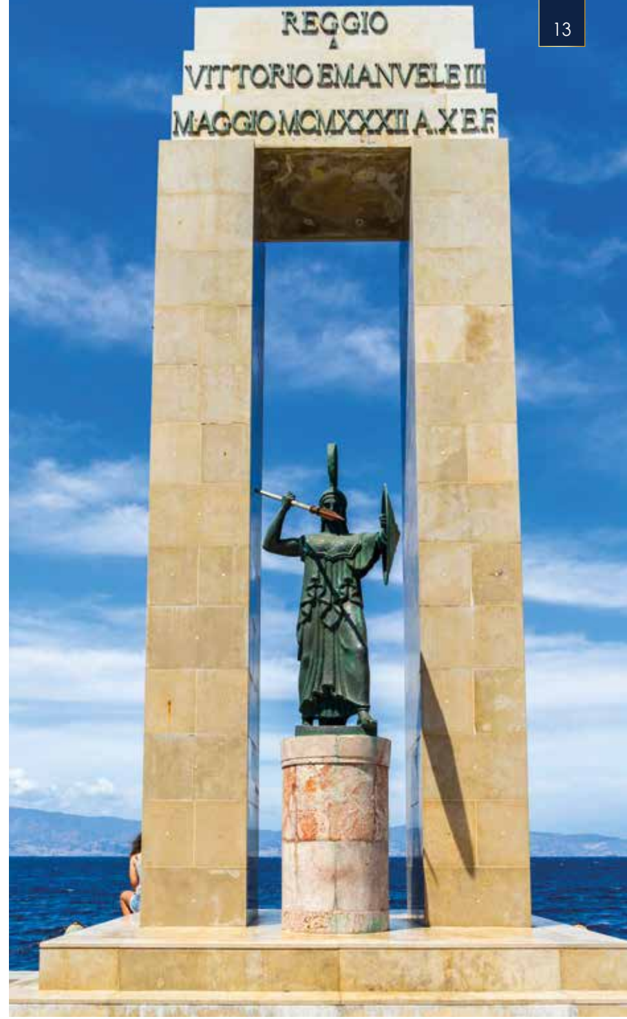
Reggio Calabria, die Stadt der Bronzestatuen