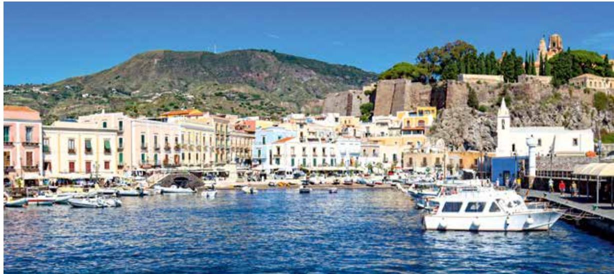
Auf der Insel Vulcano haben Sie freie Zeit für einen Spaziergang