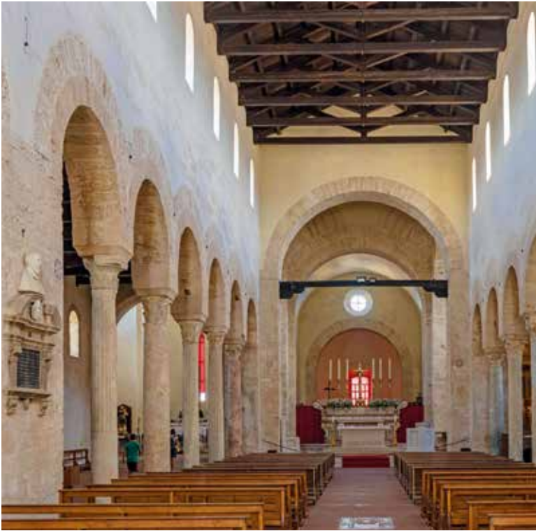
Griechische Kolonnade im Inneren der Kathedrale